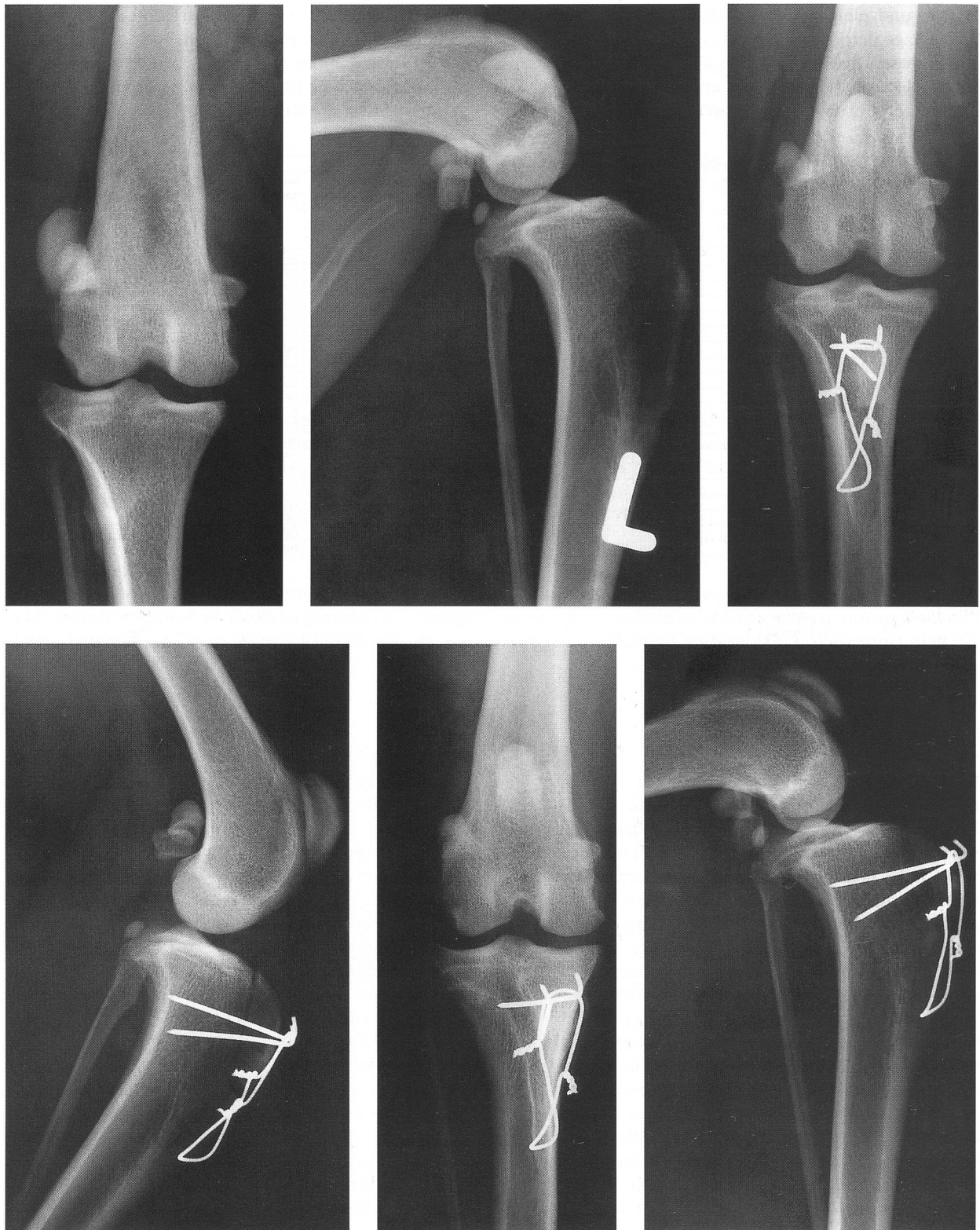
Abbildungen 2 a bis 2f: Anterioposteriore und lateromediale Röntgenbilder des linken Kniegelenkes eines zweijährigen Mischlinghundes. Die Patella luxiert im Grad 3 nach lateral, die Arthrosebildung ist mild (a, b). Nach erfolgter Sulkoplastik und kranio-medialer Versetzung der Tuberositas tibiae liegt die Patella in der Trochlea femoris (c, d, postoperative Röntgenbilder). Zwölf Monate nach der Operation sind die Implantate der Zuggurtung stabil und die Arthrosebildung ist mild (e, f). Der Hund läuft lahmbefrei, die Patella ist nicht luxierbar.