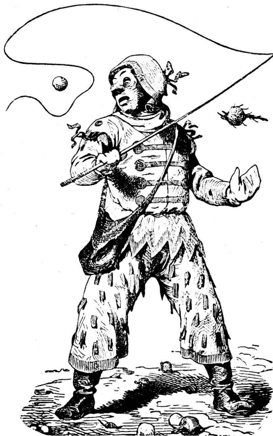
Fig. 3. Der „Hegel.“