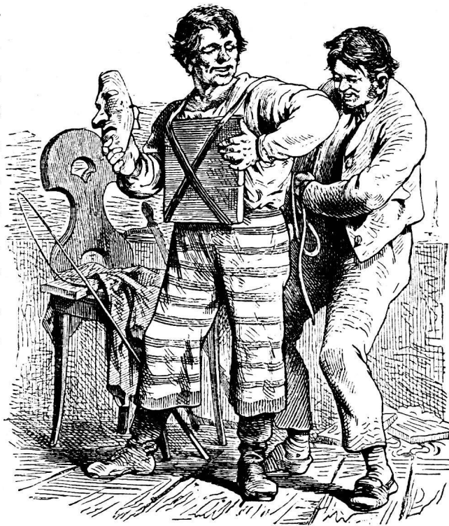
Fig. 2. Ausstaffierung des Hegels.

Wenigstens dem Namen nach ist mit ihr verwandt die — oder mundartlich das — „Gret Schäll“ in Zug. Nach der Angabe im Schweiz. Id. (II 824) wäre sie eine Puppe, was nicht ganz zu der bildlichen Darstellung im Zuger Kalender von 1875 stimmt, wo sie als lebende Fastnachtfigur, gefolgt von einer lärmenden Schar, eine mächtige Peitsche schwingend, durch die Strassen zieht. In der Legende, wonach die Gret Schäll wirklich existiert haben soll, mischen sich wohl Wahrheit und Dichtung. Für die „historische“ vergleiche man diese Zeitschrift S. 67, Anm. und die genannte Stelle im Idiotikon. Den Namen würden wir ohne weiteres für fingiert halten — schon wegen des umgehängten Schellengurts, — wenn nicht das Geschlecht der Schäll in Zug ein ganz bekanntes wäre. 1) Dazu treten die bestimmten Daten (1672 bis 20. Sept. 1740), die auf die Existenz einer solchen Persönlichkeit hinweisen. Dem gegenüber ist jedoch festzuhalten, dass die Fastnachtfigur jedenfalls älter ist, und namentlich die Sage von dem Mann im Rücken-