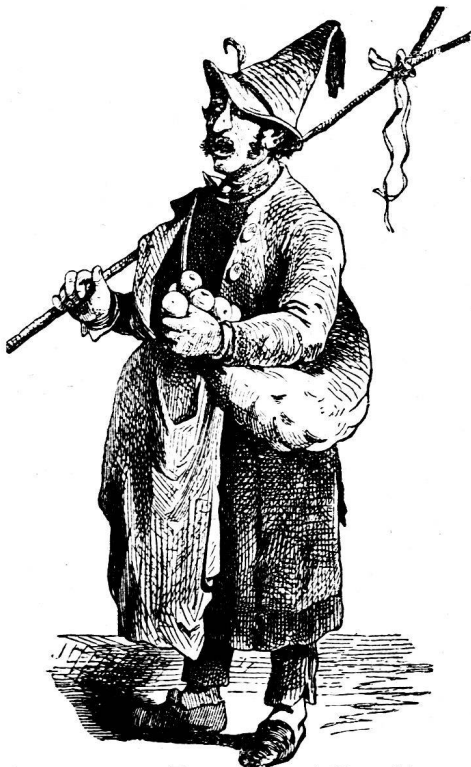
Fig. 4. Der „Aetti-Ruedi.“

In dem Städtchen Klingnau (Kt. Aargau) hat noch weit in unser Jahrhundert hinein der Hegel oder Räbe-Hegel sein Unwesen getrieben. Seine Ausstaffierung, sein Kostüm und sein Auftreten ist hier in Fig. 1 bis 3 dargestellt 2) . Am „schmutzigen Donnerstag“ erscheint die Schreckgestalt an der Schulthür und bittet den Lehrer höflichst, der Jugend frei zu geben. Und nun geht das tolle Treiben los. Von der ausgelassenen Jugend gehetzt und mit Wasserrüben ( Räben ), Kohlstrünken etc. bombardiert, eilt der Hegel durch die Gassen, hier einem allzu Zudringlichen die Peitsche um die Ohren klatschend, dort einen Unvorsichtigen erhaschend, um ihn in den nächsten Brunnen zu werfen. Dabei vergisst er aber seine Hauptbestimmung, vor den Häusern zu betteln, nicht, und selten wird ihm der sauer verdiente Tribut versagt. So treibt er sich stundenlang herum, bis er alle Strassen abgelaufen hat und endlich seine Unbill hinter einem Glas Wein vergessen darf. 3)