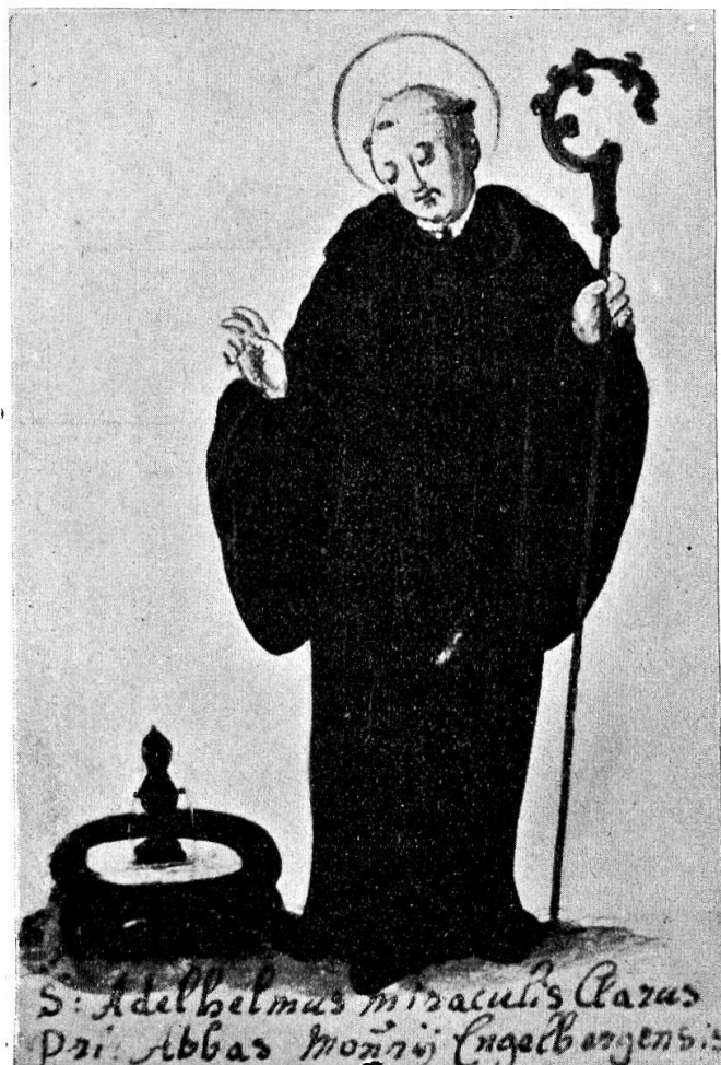
Fig. 3. Der sel. Adelhelm von Engelberg.

amabilis, Pastor bona, de bono consilio und die Gnadenbilder von Loreto und Einsiedeln). Besonders populär waren Bilder von S. Anna, Joseph, Andreas, Catharina von Alexandrien, Georg, Petrus und Johann von Nepomuk. Auch S. Michael und Raphael (Angelus Custos), mehrere Apostel, Urheilige, Ordensheilige (Taf. III), schweizerische Heilige (Fig. 1) und Selige (Fig. 2 u. 3), ferner Katakombenheilige (Figur 4 u. Tafel IV), deren Leib in der Schweiz ruhte, folgen. 15) Es ist unmöglich, die vielen Namen — es dürften in der deutschen Schweiz allein bei dreihundert verschiedene