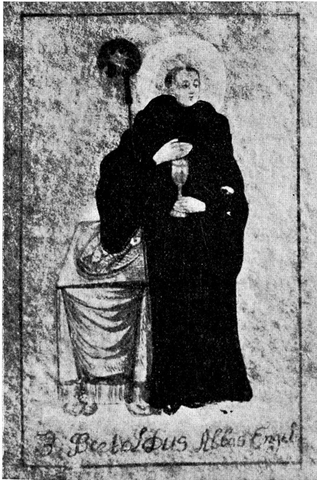
Fig. 2. Der sel. Bertold von Engelberg.

fanden, wurden nun mehr oder weniger frei, d. h. vereinfacht, kopiert; besonders beliebt waren Einzelfiguren von Heiligen 14) , Brustbilder und Symbole. Mit gewandtem Pinsel malte der Kopist oder die Kopistin diese Themata auf Pergamentblätter hochrechteckigen Formats. In welcher Weise dies geschah, zeigt besser als eine Beschreibung ein Beispiel von Engelberg. Unsere Tafel IV zeigt links das Urbild, einen Stich, rechts das Pergamentbild, eine Handmalerei. Das Format des Blattes ist ein kleines, gewöhnlich überschreitet es nur wenig die Grösse unserer Visit-