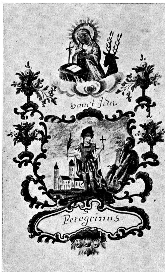
Fig. 4. Der Katakombenheilige Peregrin, darüber S. Idda.

Eine besondere Klasse von Bildern, welche vorzugsweise Symbole und Allegorien enthalten, bezeugt das Nachleben der Mystik in der Barock- und Rococozeit. Die Passionsinstrumente, besonders aber das Herz Jesu geben Anlass zu den merkwürdigsten Darstellungen. Wir gehen kaum fehl, wenn wir die Herstellung der Pergamentbilder mit derartigen Bildern und zugehörigen Sprüchen (s. unten) in den Nonnenklöstern, speziell bei den Dominikanerinnen suchen.