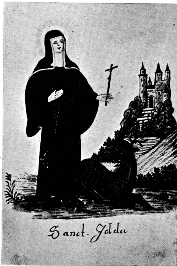
Fig. 1. S. Idda von Fischingen.

Die Kupferstiche der aufgezählten Meister, die sich in grosser Zahl in allen Klöstern 12) , sogar zu Sammlungen vereinigt 13) vor-