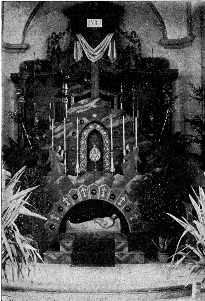
„Heiliges Grab“ in Jonen (Pfarrkirche).

verhüllten Kruzifix 1) und in Begleitung von Sigrist und Ministranten in den Chor hinauszutreten. Das Kreuz ist bedeckt, „weil die Ehre des Kreuzes anfänglich ganz unbekannt gewesen und erst allgemach in die Welt eingeführt worden sei“ (Coffine). Nun wendet sich der Priester zum Volke und fängt an, das