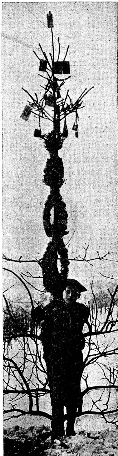
Ein „Balmen“ aus Jonen.

Der Palmsonntag eröffnet „d'Charwoche“. Auf den Palmsonntag freuen sich die kleinen Buben, die gerne „e Balme“ [masc., Palme] zur Kirche tragen möchten. Dieser Palmens wird am Vorabend des Palmsonntages vom Vater oder sonst einem kundigen Familiengliede gemacht. Man schneidet zu dem Zwecke im Walde ein Tännchen mit zwei bis fünf Astquirle, „astet“ es auf, dass bloss noch die kräftigsten Ästchen der Quirle und die Spitze übrig bleiben. Alsdann wird am untern Ende des Stämmchens, sowie an den Ästchen die Rinde sauber entfernt; hierauf steckt man an die Ästchen des untersten Quirls etwa ein Dutzend Stechpalmenblätter, nachher einen schönen Apfel, dann wieder Stechpalmenblätter, hierauf wieder einen Apfel und so fort, bis das Ästchen mit Blättern und Äpfeln besetzt ist. Nun werden die Ästchen aufwärts gebogen und mit ihren Spitzen nebst einigen „Ephi-Schösslene“ [Junip. sab.] oder Buchsschösschen mittelst Bindfaden fest an das Stämmchen gebunden. 1) Ist der unterste „Chranz“ oder „Ring“ fertig, so beginnt man mit dem zweiten. So geht es dann fort, bis alle Quirle oder Kränze gemacht sind. Schliesslich wird der Palmens unten mit Tapetenbordüren umwickelt, oben mit Heiligenbildchen und Skapulieren behängt, dieses Jahr in Lunckhofen auch mit