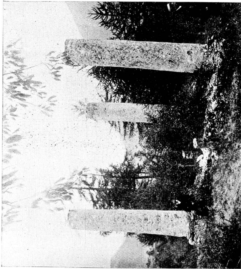
Fig. 1 Galgen in Ermen