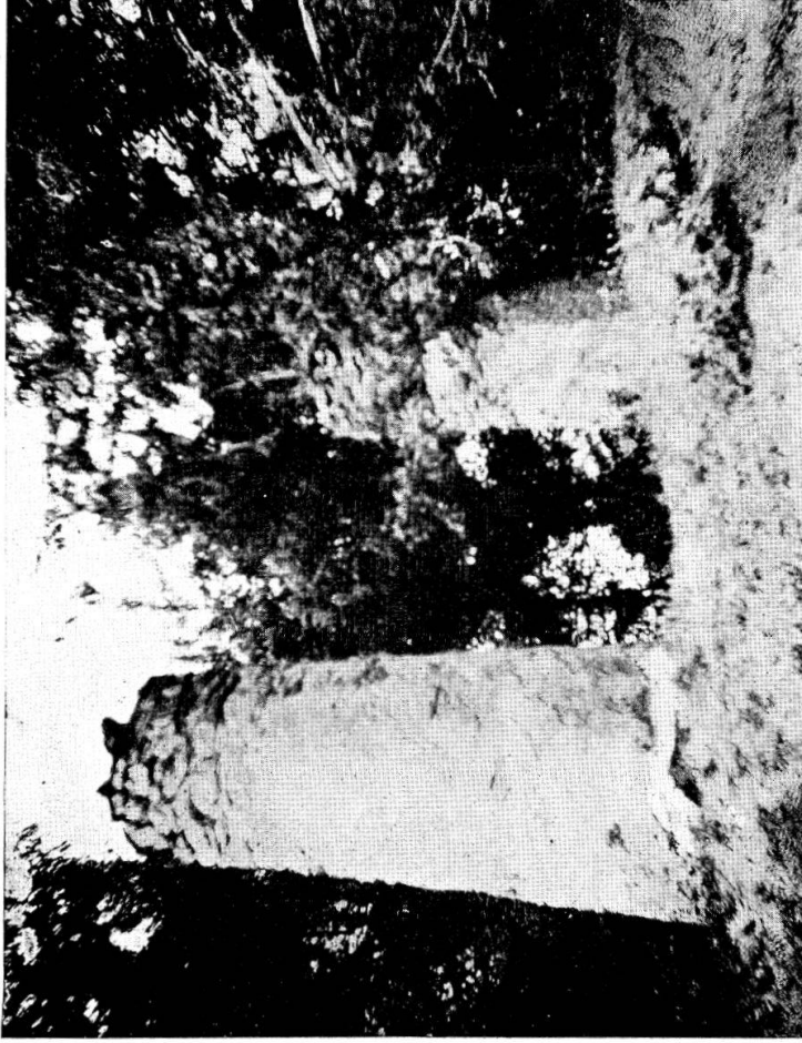
Fig. 4 Galgen in Jürgenberg