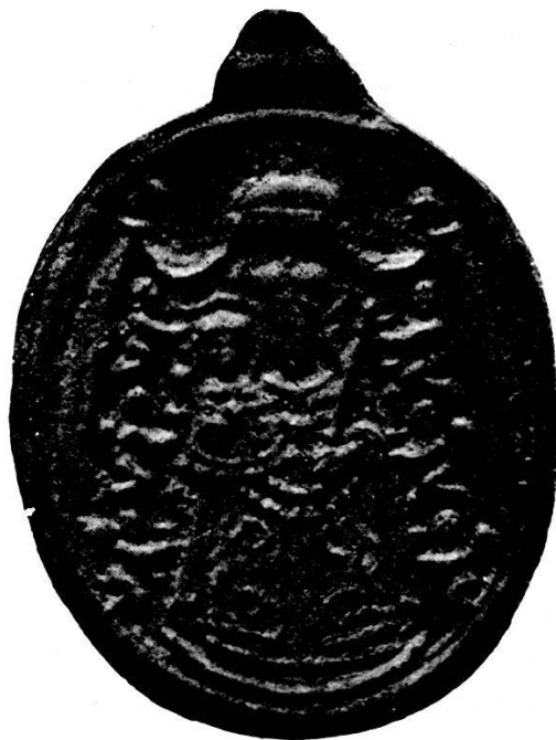
Fig. 2. Das bekleidete Bild von Mariastein. Gnadenpfennig.

Weise prunkvoll bekleidet erscheint. Das Jesuskind allein kommt auf Kupferstichen von Prag, Sorso u. A. im Prunkmantel vor. Auch in gewaltigem Maßstab, fast naturgross, werden gelegentlich Gnadenbilder in Holzschnitt oder Stich vervielfältigt; derartige Bilder werden gleich Plakaten zur Erinnerung an vollbrachte Wallfahrt in den Kirchen aufgehängt. In Graubünden und Tessin findet man sie noch da und dort. Unsere Tafeln reproduzieren zwei derartige Riesenblätter; das eine zeigt das Gnadenbild von Einsiedeln. Schon anfangs des XVI. Jahrhunderts mit Geschenken behängt, besitzt dasselbe im Jahre 1577 kostbare Mäntel und wurde 1602