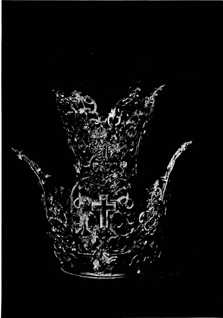
Fig. 1. Krone im Schatz von S. Urs in Solothurn.

der schmerzhaften Mutter in der Riedkapelle. Die Gewänder, schwarz, rot, gelb usw. stammten aus dem XVII., XVIII. und XIX. Jahrhundert 1) ; seit der Restauration der Kapelle werden sie nicht mehr benutzt. In Luzern wird 1629 die Bekleidung der Figuren, die zur Weihnachtskrippe der Franziskanerkirche