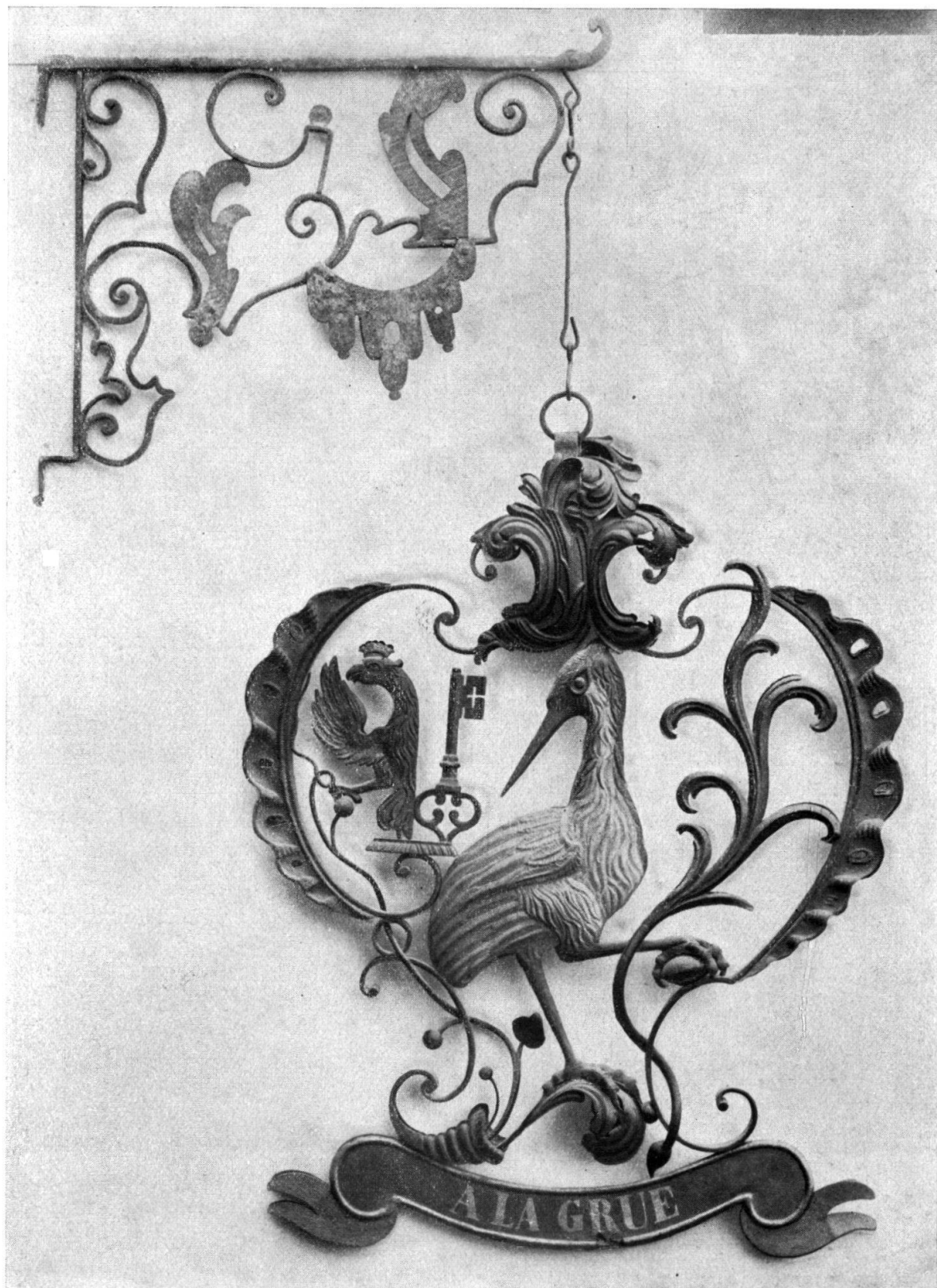
Fig. 1. La Grue