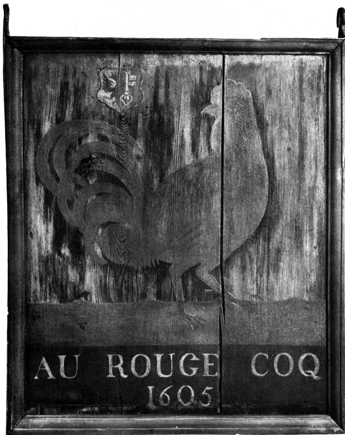
Fig. 2. Le Rouge Coq