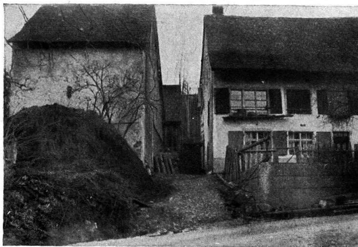
3. Bild. Haus mit freistehenden Bienenkörben. Wohn- und Wirtschaftsgebäude ausnahmsw. getrennt. l. Düngerhaufen, r. Hausgarten mit Lattenhag. Betr. Lokalität vgl. 2. Bild.