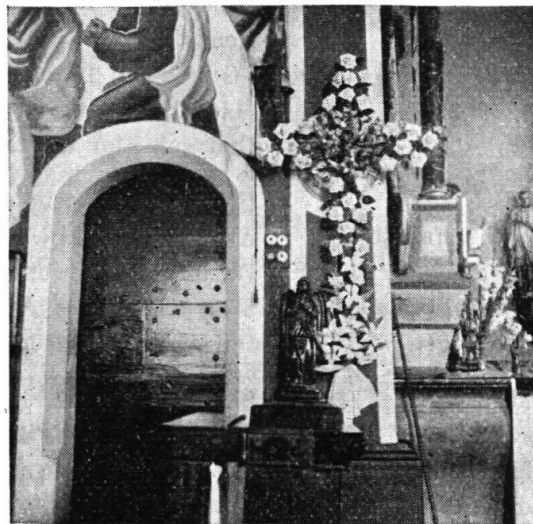
Fig. 3. Croix fleurie de jeune homme, déposée à côté de l'autel, à l'église de La Roche.