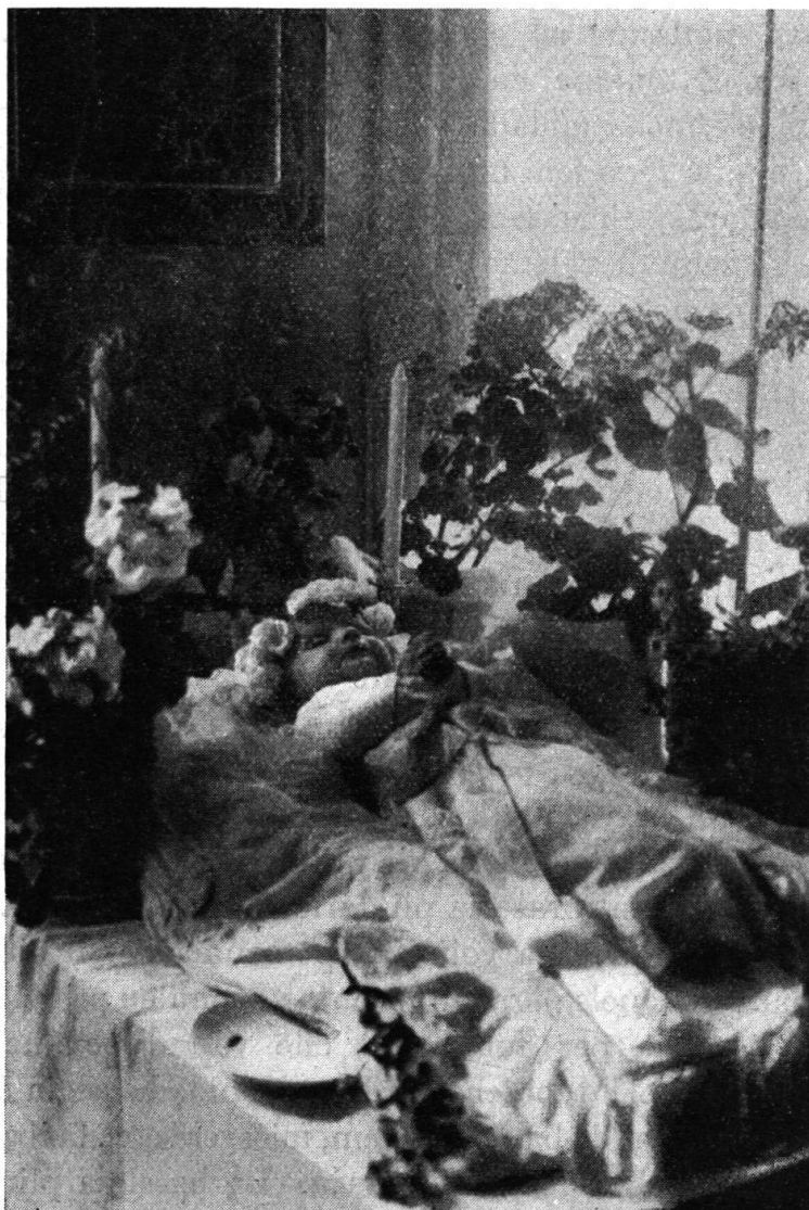
Dardin. Baret vestgius en e mess en bara, ornaus cun fluras, tschupi e tenend mauns da ludaus.

ei svaniu dil tut. Gnanc il gi pli van ils affons stedi. Pli baul denton vegnevan ils barets vegliai, sco aunc oz las baras grondas, tuttas treis notgs; avon mesanotg era la stiva pleina, mo era suenter steva enzatgi vegliond tochen la damaun. Buca da gitg essan nus intervegni ch'ins hagi en ina casa d'in vitget nuota pli vegliau baret suenter mesanotg, e che in'otra famiglia cun baret hagi serrau igl esch la sera ed i a letg e pera schau spluntar la buna glied che levan, suandont veglia tradiziun, far lur oraziuns. Per ordinari fan ins buca quei! Da quellas famiglias paran de tener pauc culs paternos. Sil-