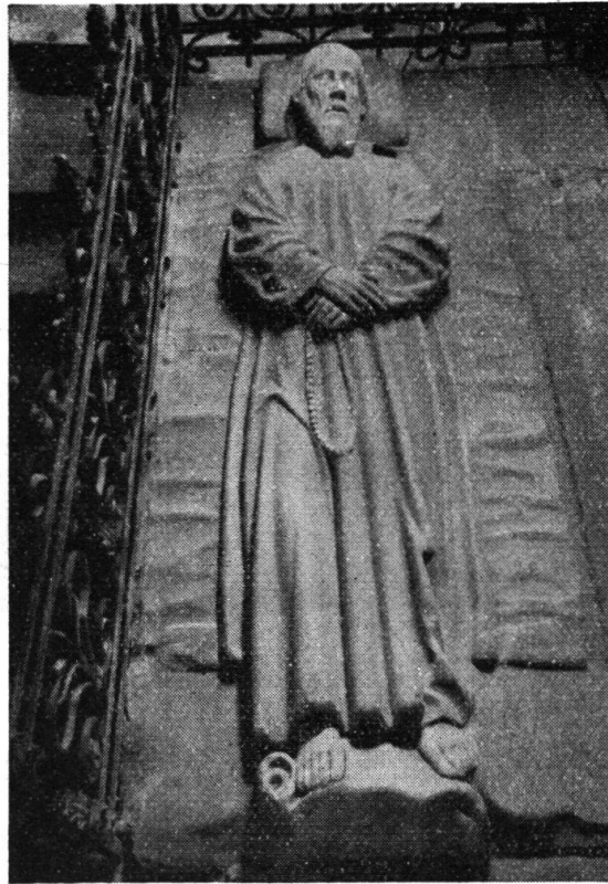
Grabplatte von 1518 im Beinhaus Sachseln. Über der linken Schulter ist die viereckige Öffnung sichtbar.

ein Zugang, der tagsüber offengelassen wurde, damit die Pilger das Grabmal mit dem Körper berühren, corpore sepulchrum contingere , und die Statue küssen konnten 1 . So wird das Grabmal schon auf dem um 1520 gemalten Freskenzyklus in der untern Ranftkapelle dargestellt 2 .