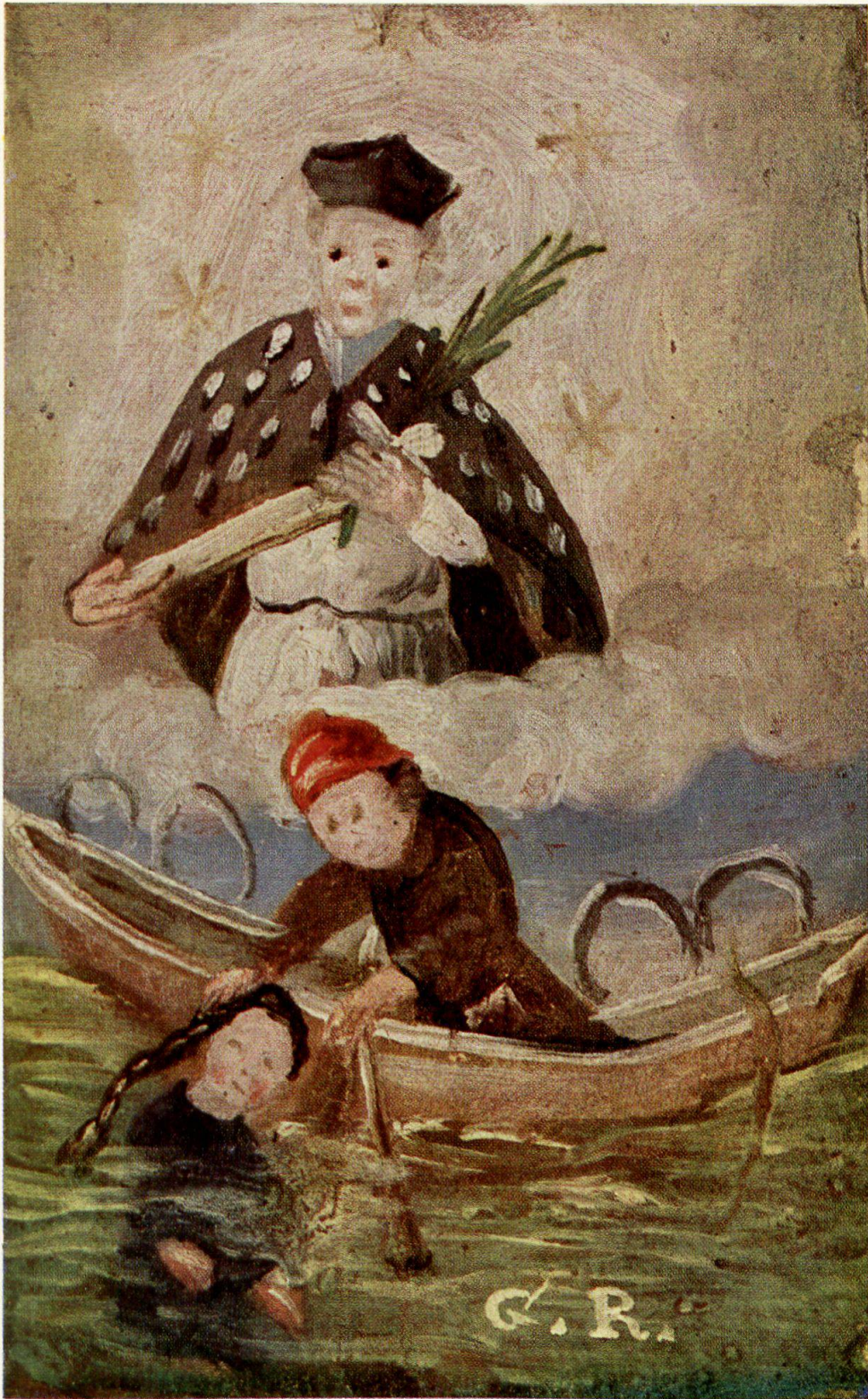
Votivbild aus Loco 18. Jahrhundert