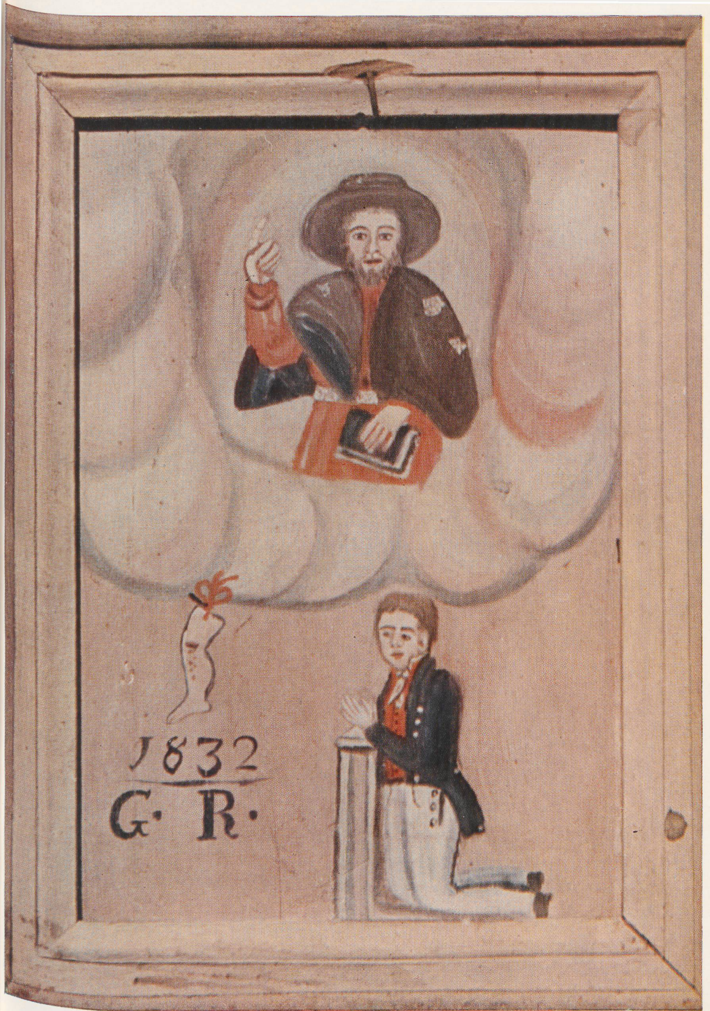
Votivbild aus San Pellegrino bei Giornico