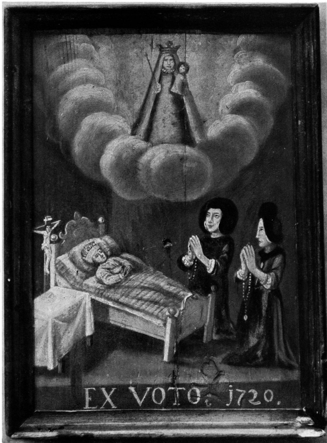
Votivbild aus Niederrickenbach