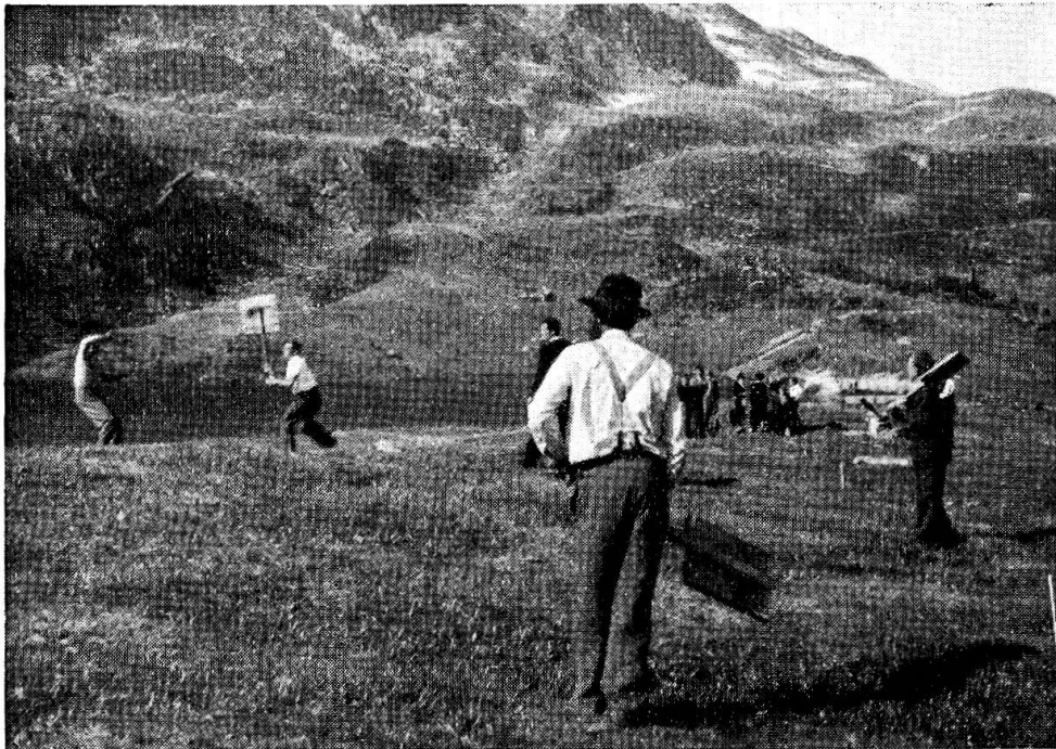
Abb. 2. – Die Gegenpartei beim Abfangen des Wurfkörpers (Betten 1953).

Spieler abwechslungsweise aus den Teilnehmern ihre Mitspieler auswählen. Um den ersten, der wählen darf, zu bestimmen, hält man eine Schindel vor sich hin, bezeichnet die eine Seite mit einem Kreidestrich, mit einer eingeritzten Kerbe oder auch nur indem man darauf spuckt. Hierauf wirft man die Schindel in die Höhe, so dass sie sich dreht. Diejenige Seite, die nach oben zu liegen kommt, entscheidet. Auf ganz gleiche Weise bestimmt man die Partei, die als erste mit dem Schlagen beginnen kann. Doch zuerst muss das Spielfeld ( griss ) abgesteckt werden. Die Schläger richten den Bock ( šuslatte ) her, der aus einem dünnern Tannenstämmchen besteht, das auf der einen Seite mit Steinen unterlegt wird (Abb. 1), so dass es schräg aufwärts in die Luft schaut. Das untere Ende wird leicht in die Erde eingegraben und mit weitem Steinen beschwert, damit der Bock ganz ruhig liegt. Auf der aufragenden, oberen Seite wird die Oberfläche mit einem Beil glatt gehauen, so dass der Wurfkörper ( beinkue ) gut aufliegt (Abb. 3). Als Wurfkörper dient der sich im Hufe einer Kuh befindende Knochen, also der äusserste Zehenknochen. Aus Erlenästen oder Haselstauden werden einige Stöcke in der Länge von zwei bis drei Metern geschnitten.