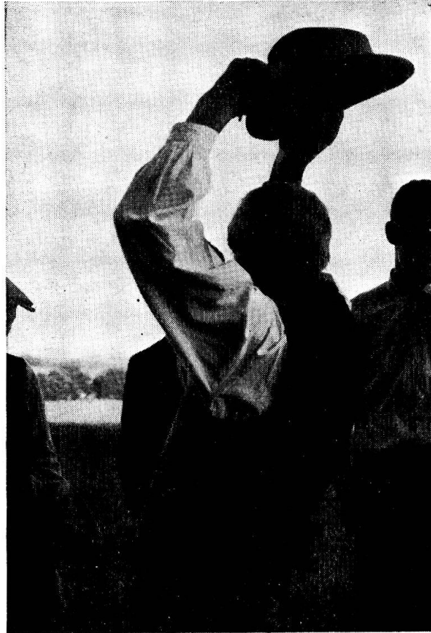
Abb. 5. Beim Loswerfen (Huttwil 1954).

womit Gewähr geleistet ist, dass niemand die Entscheidung des Loses nachträglich umgehen kann.