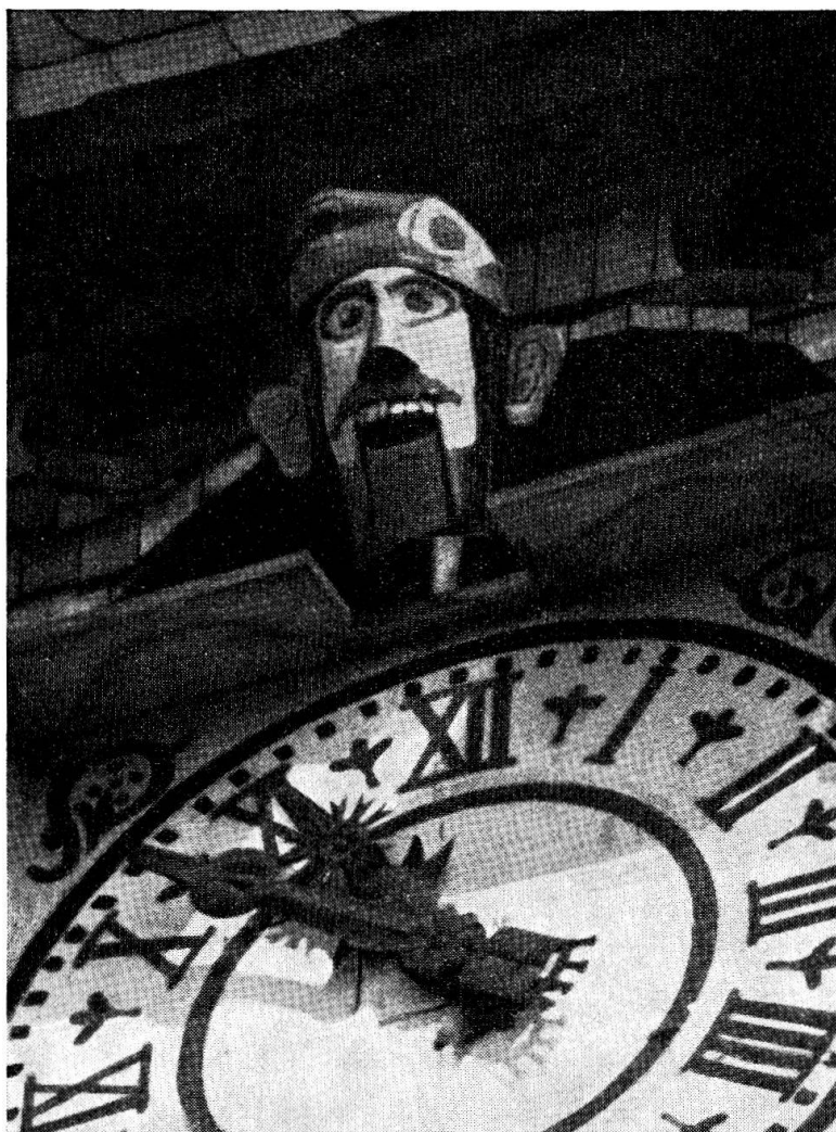
Abb. 3. Mutzig (Unterelsass): der «Rothüsmann».