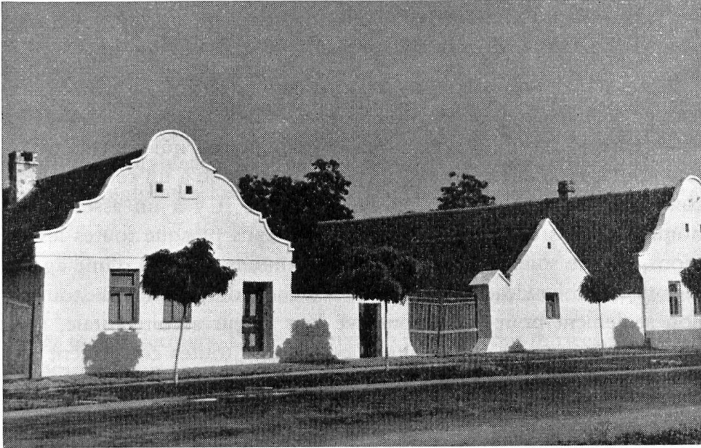
Fig. 2. Maisons rurales de Vojvodine (Serbie).