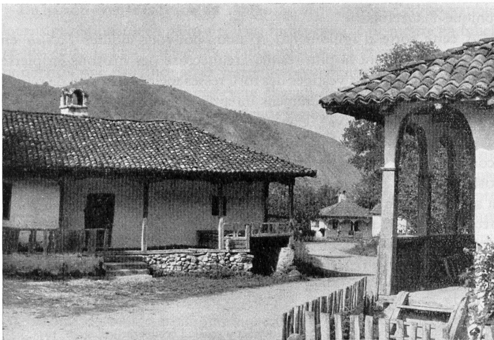
Fig. 3. Village de la région de Djerdap (Golubinje – Serbie).