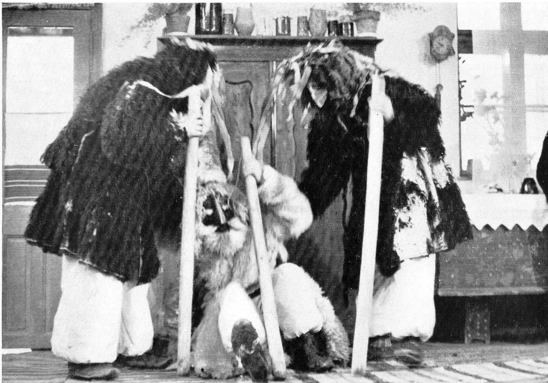
45 Die vermumnten Hirten im Weihnachtsspiel zu Kakasd. Ungarisches Ethnographisches Museum, Budapest, F. 195.760.