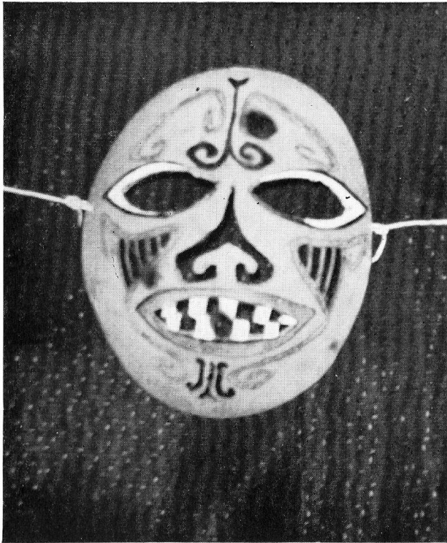
44 Kürbismaske. Komitat Somogy.