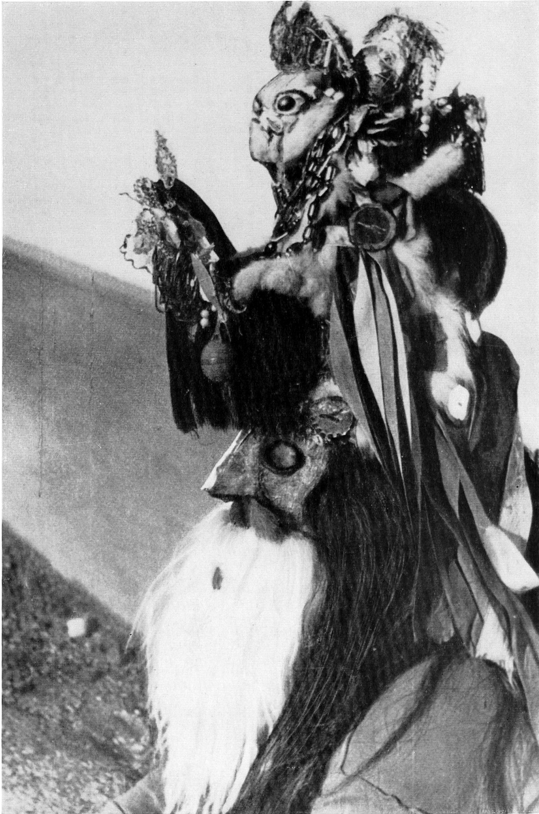
8 «Der Alte» aus dem Gebiet von Bacău. Neujahrsmaske.