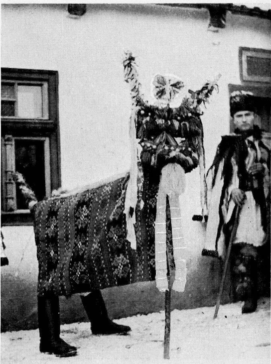
4 «turca» aus dem Gebiet von Mureş, gebraucht an Neujahr.