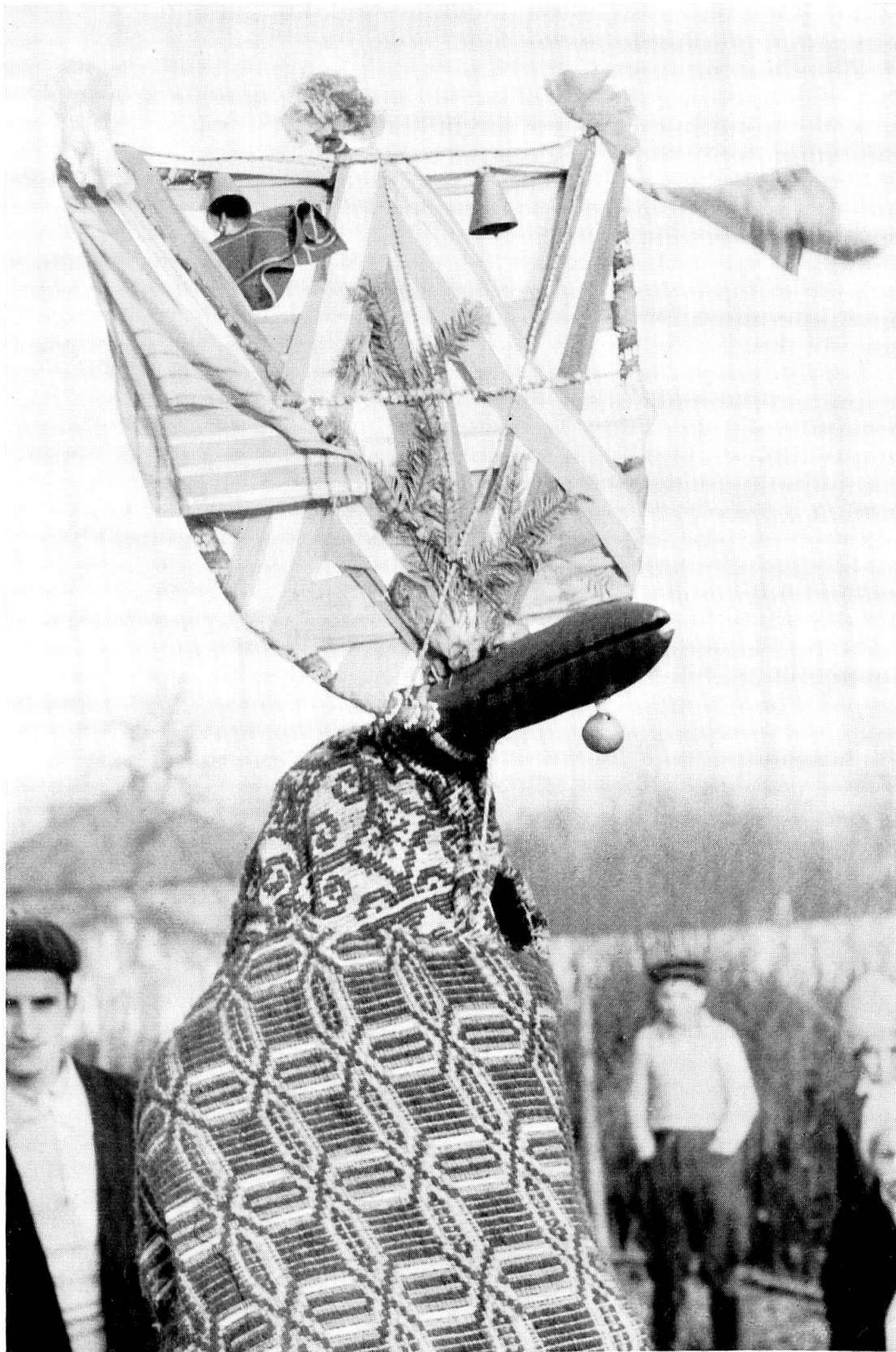
1 «brezaia», aus Muntenien. Neujahrsmaske.