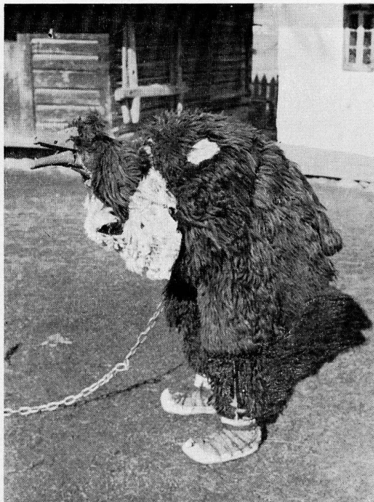
3 Bärenmaske aus dem Gebiet von Suceava, gebraucht an Neujahr.