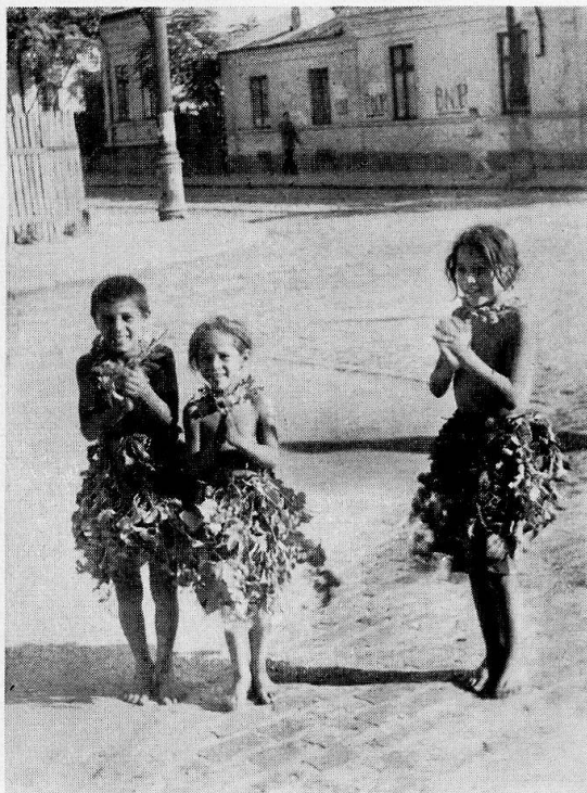
5 «paparude», Regenmädchen, aus Muntenien.