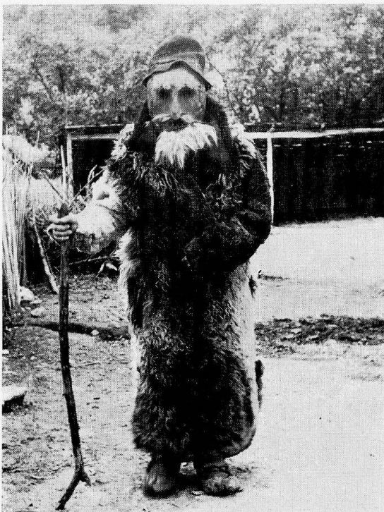
2 «Greis» oder «der Alte», aus Vrancea, gebraucht bei der Leichenwache.