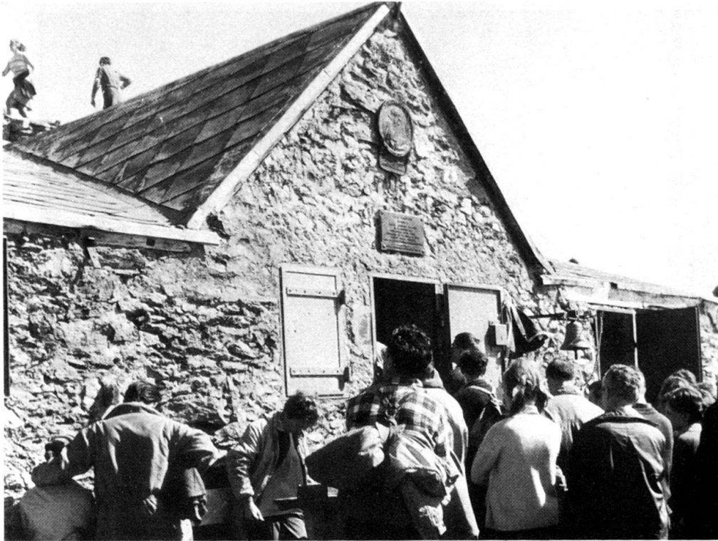
Abb. 3. Madonna di Rocciamelone während der Messe (4. August 1968).