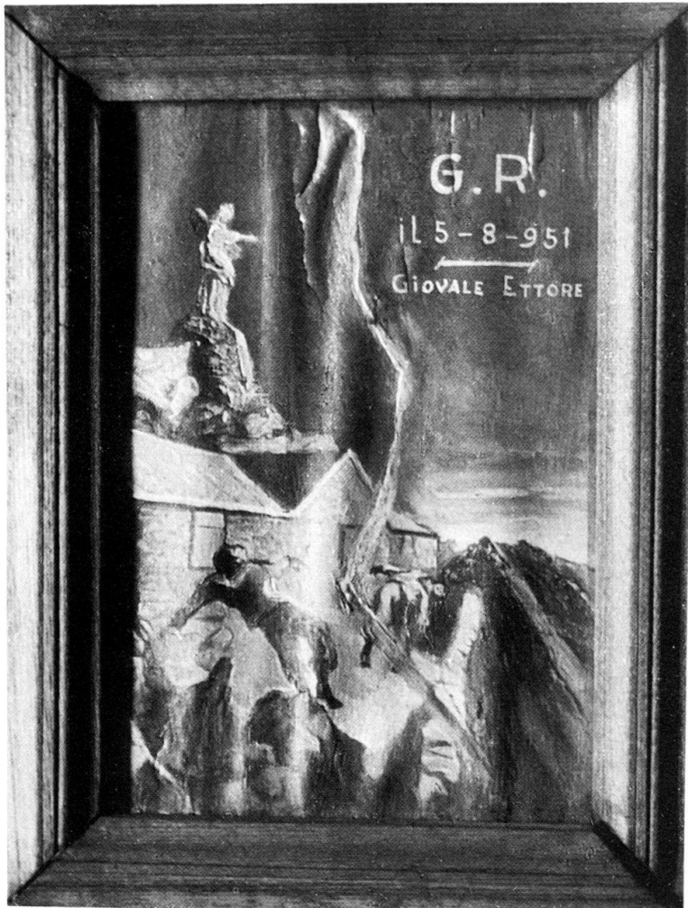
Abb. 5 Votivtafel in der Gipfelkapelle des Rocciamelone.