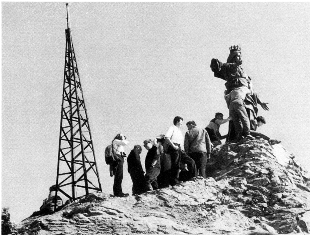
Abb. 6. Auf dem Gipfel des Rocciamelone. Marienstatue und Blitzableiter.