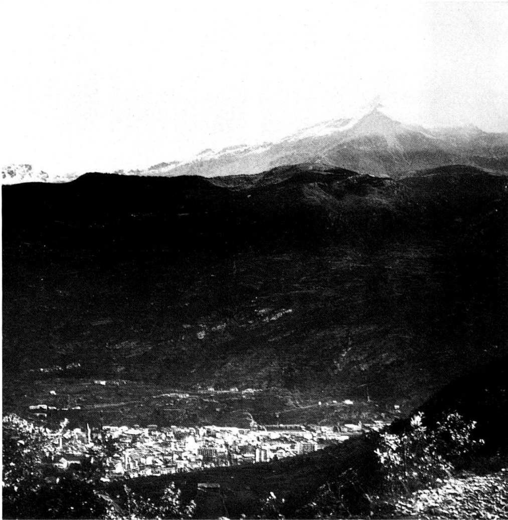
Abb. 1. Susa mit Rocciamelone.