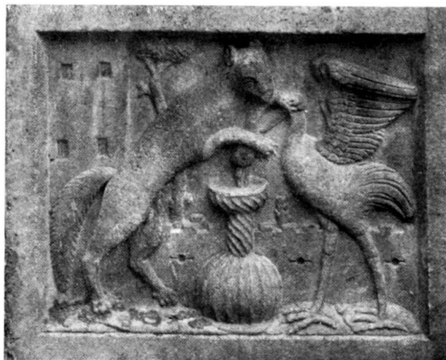
Abb. 4. Teilstück vom Grabmal für Hans Katzianer, Oberburg-Gornjigrad in Slowenien, 1539.