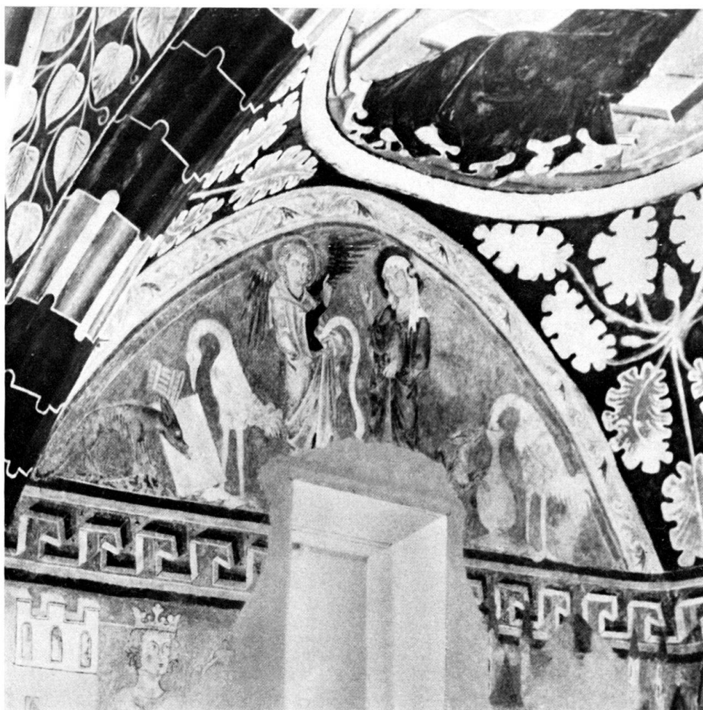
Abb. 1. Chorwandfresko: Maria Verkündigung und Phädrus-Äsop-Fabel vom Fuchs und vom Storch (Kranich), 14. Jh., Kirche St. Georg in Rhäzüns bei Chur, Graubünden.

Aufnahme: Archiv des Amtes für Denkmalpflege im Kanton Graubünden, Neg.-Nr. 5840.