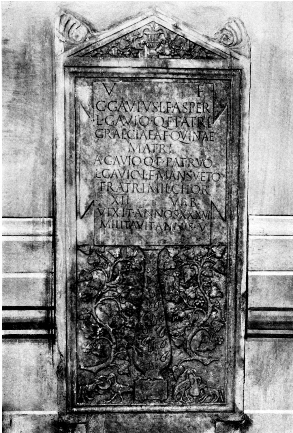
Abb. 2. Relief-Grabstein der Familie der Gabii, 1. Jh. n. Ch. zu Empoli bei Florenz.