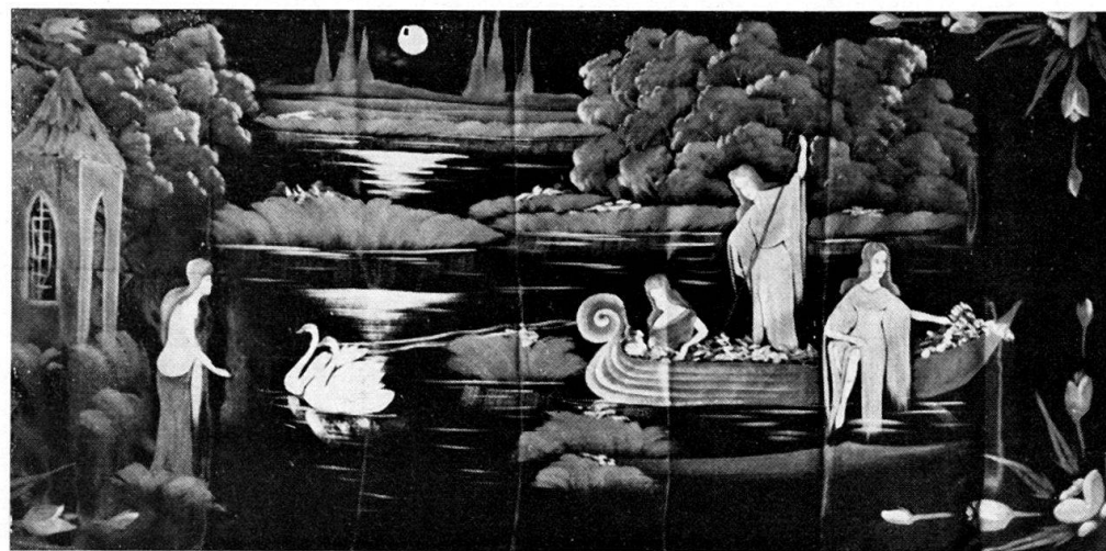
Abb. 8. Zauberlandschaft. Gemalt auf Satin, anonym, gekauft in Pommern.