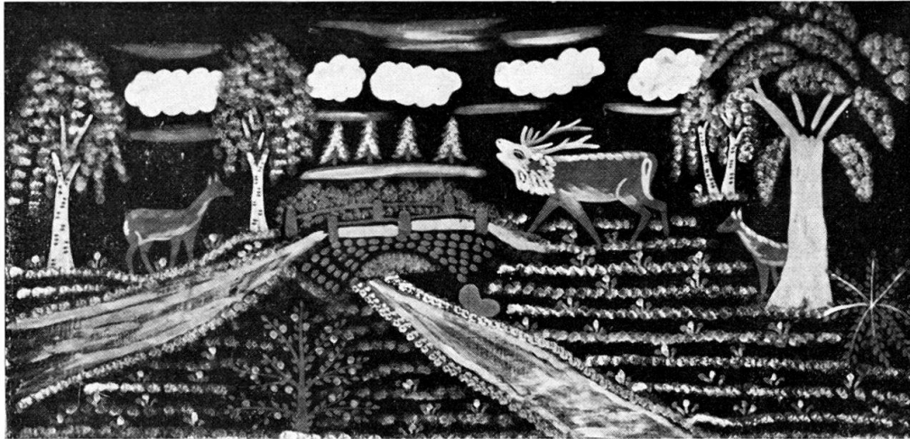
Abb. 6. Die Hirsche. Gemalt auf schwarzem Satin von Klara Kuchta aus Dąbrowka bei Stargard (Danzig). 80 × 162 cm.