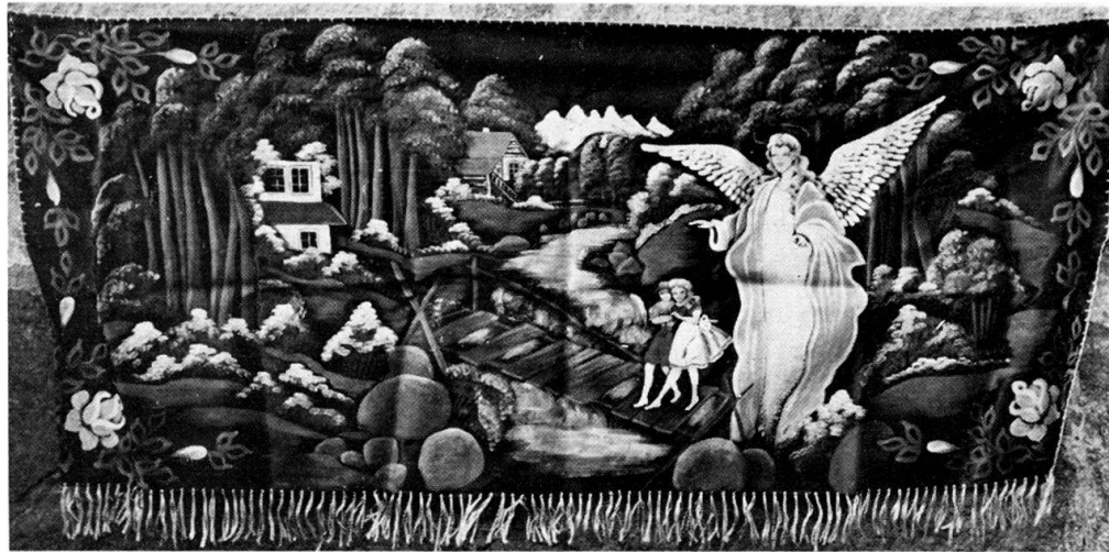
Abb. 7. Der Schutzengel. Anonym, gemalt auf Satin in Łódź, gekauft in Pommern.