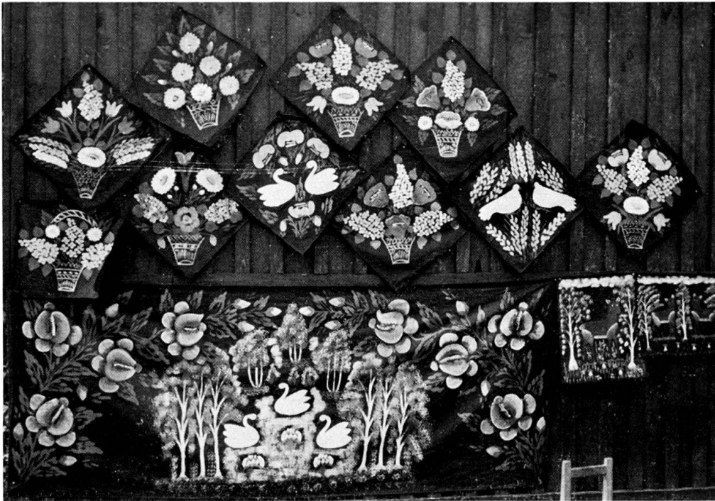
Abb. 2. Ein Jahrmarkt in Włodawa am Bug. Ein Stand mit «Teppichen».