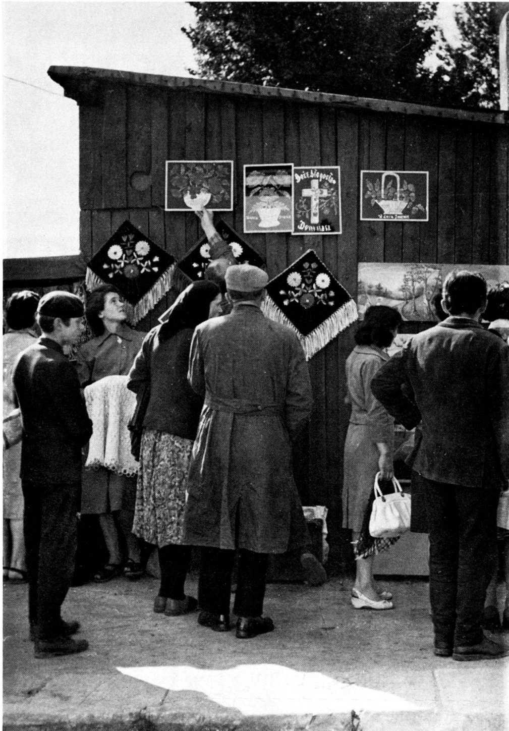
Abb. 1. Ein Jahrmarkt in Radomsko. Ein Stand mit Bildern.