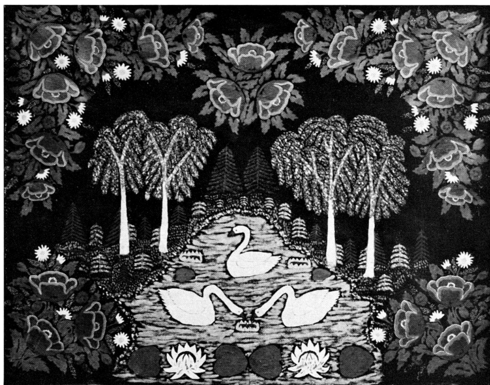
Abb. 5. Die Schwäne. Gemalt auf Leinwand von Jan Durko im Jahre 1958. Dorf Majdan bei Chelm. 140 × 180 cm.