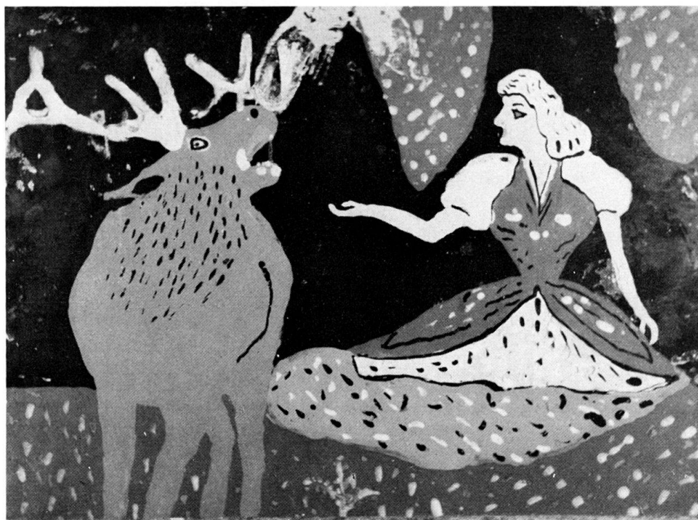
Abb. 4. Die Jungfrau und der Hirsch. Anonym, gekauft in Ochoża bei Chelm am Bug. Hinterglasmalerei, 27 × 37,5 cm.