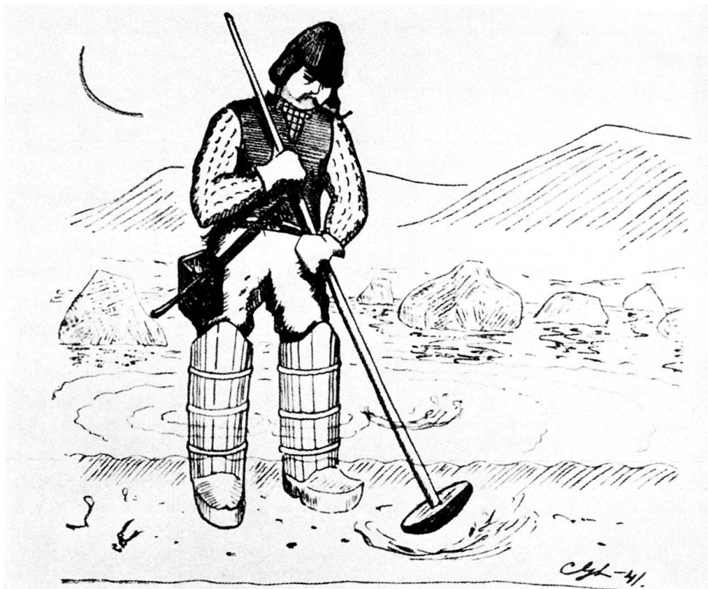
Fig. 2. Fisherman pounding lug worm. Drawing by C. G. Lekholm 1941. In his belt the man is carrying a comb for collecting worms, and he has a wooden box for holding them. He wears boots of a special construction on his feet (cf. note 7).