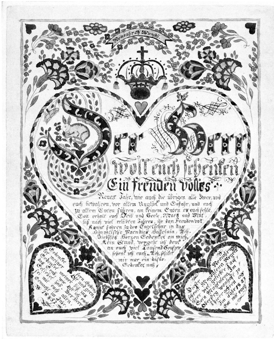
Thierachern BE, 1857, Inv. Nr. VI 47000