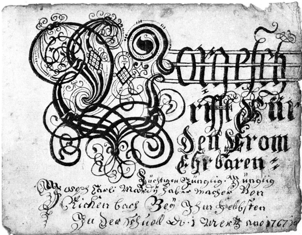
Abb. 1. Vorschriftenheft, Titelblatt. Rickenbach LU, 1767 (VI 47001).