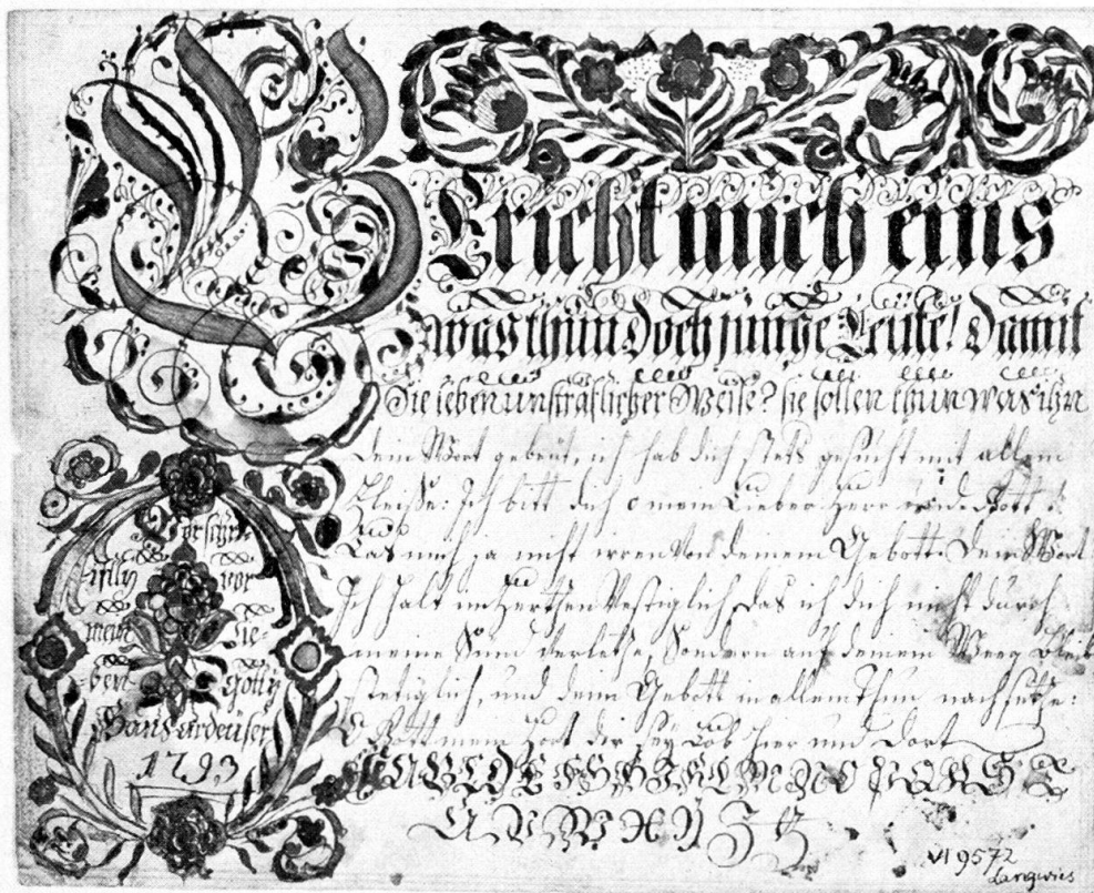
Abb. 2. «Vorschrift», kleines Format, deshalb «Vorschriftly». Langwies GR, 1793 (VI 9572).