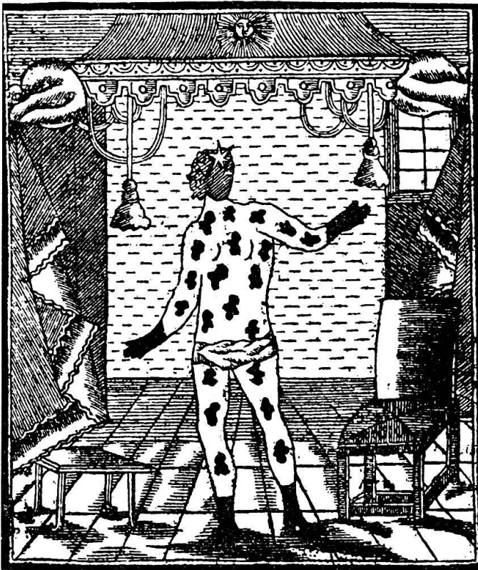
Abb. 2 Das gesprenkelte Negermädchen aus St. Lucia (Appenzeller Kalender 1784).