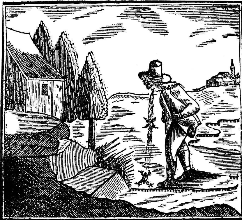
Abb. 5: «Der Kröte Trinker» Appenzeller Kalender 1790.