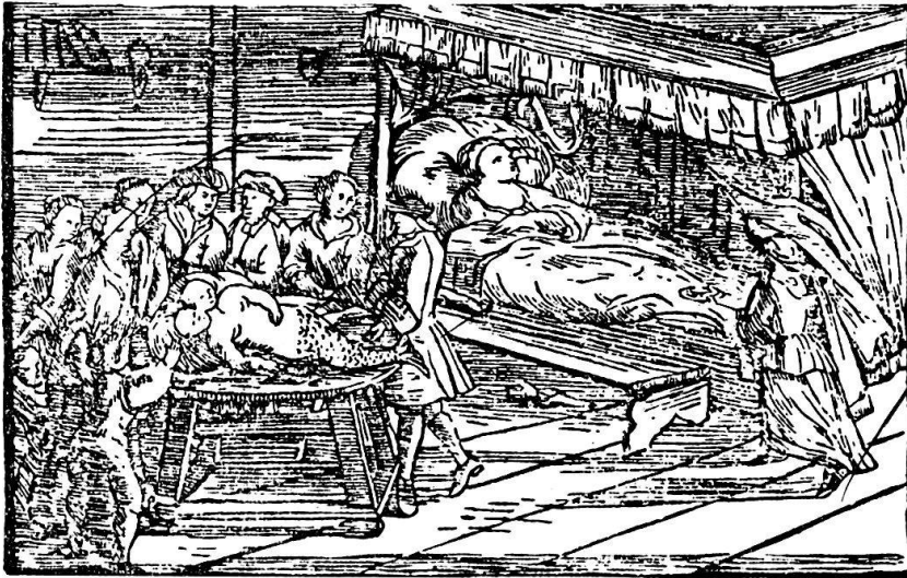
Abb. 3: Vorstellung «der hieneben beschriebenen seltsamen Missgeburt» eines doppelten Kindes mit Fischschwanz (Schreibkalender Schaffhausen 1781).