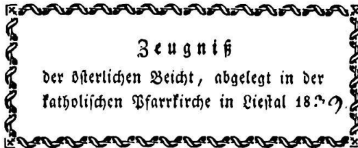
Liestal, 1839, VI 47006.

Osterbeichte 1936 Benediktinerstift St. Gallus in Bregenz