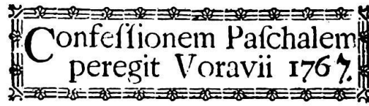
Vorau, Steiermark, 1767, VI 47005.