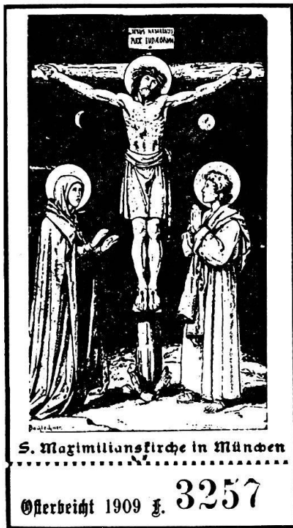
München, 1909, Slg. Thalmann, Nr. 214.