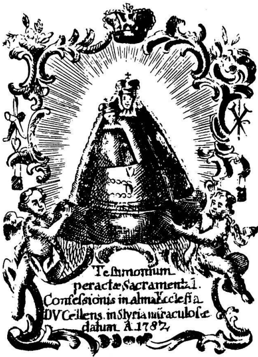
Mariazell, 1782, VI 25602.