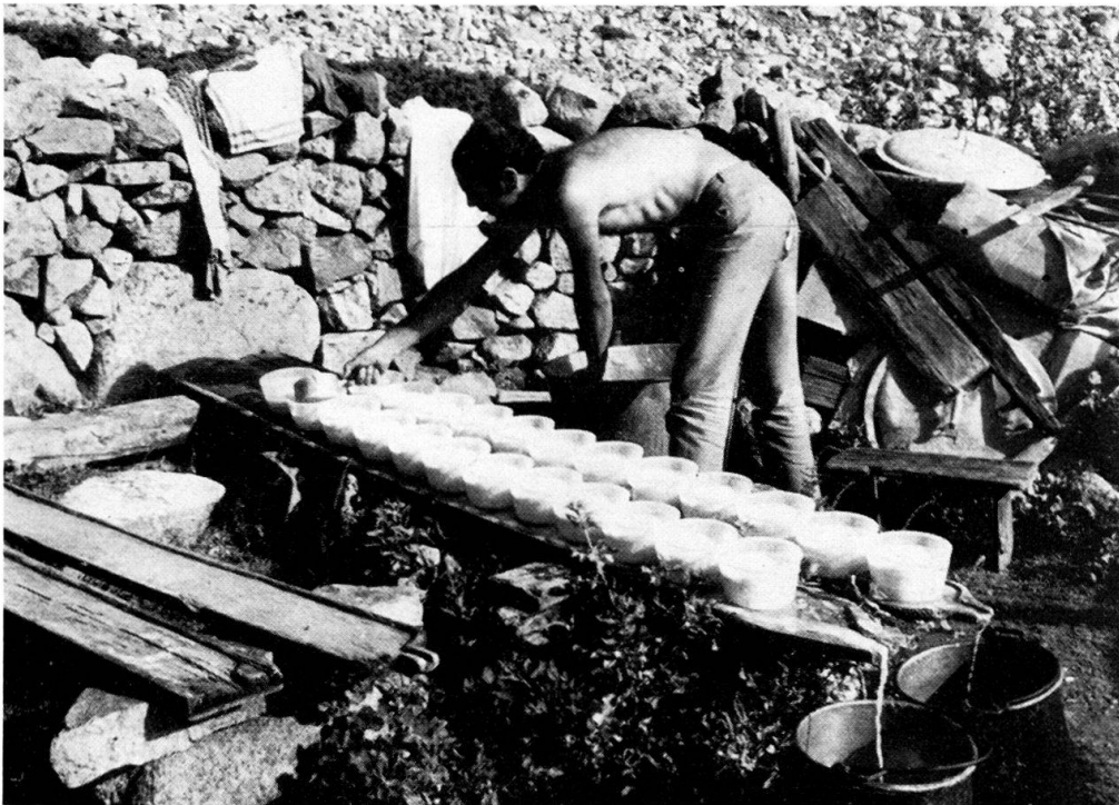
Abb. 3 Hirt an der Arbeit im Freien auf der Bergerie Valla Lungua.