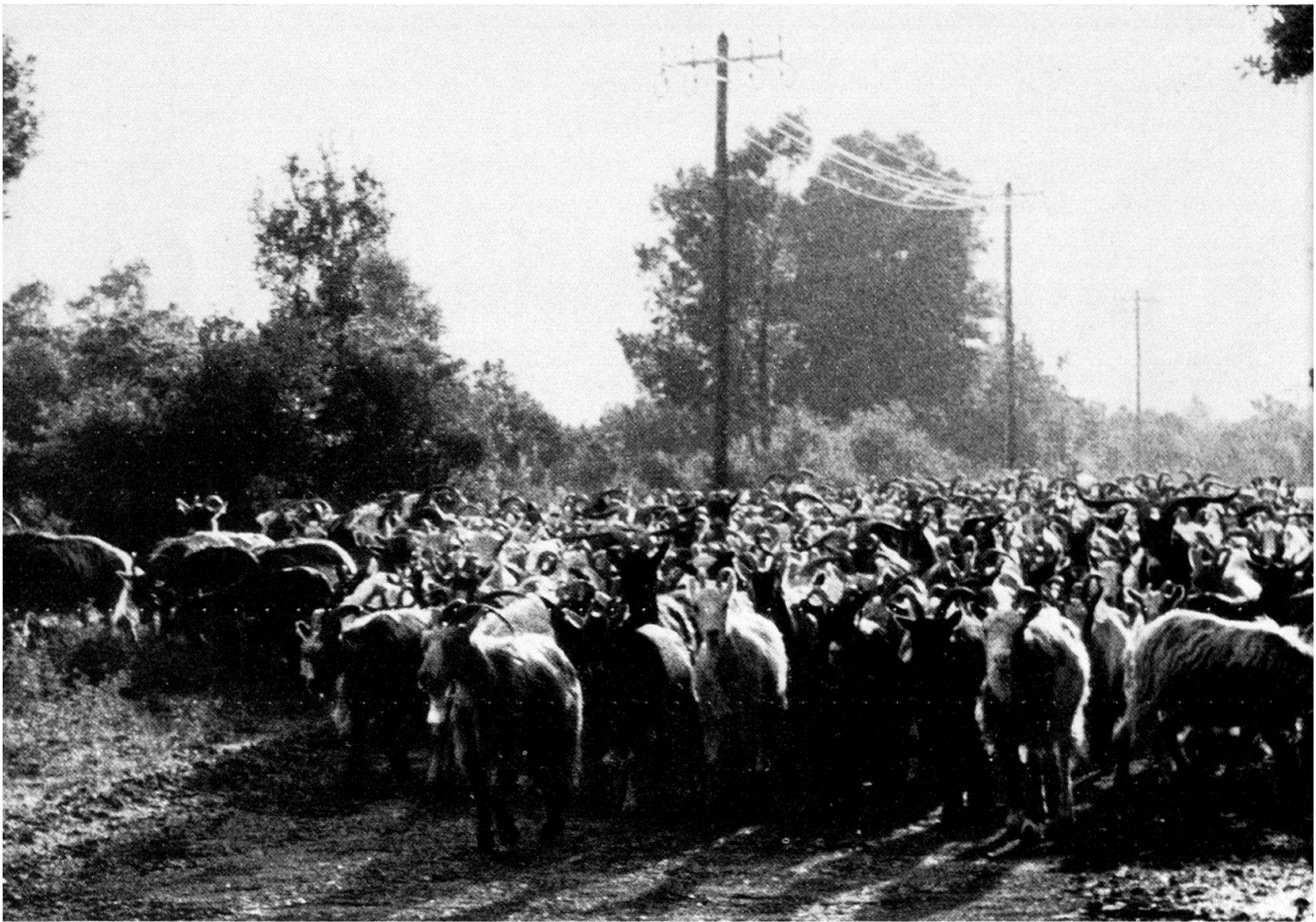
Abb. 5 Herde mit Hirt auf der Strasse im Filosorma am Ende der ersten Phase der Transhumanz.