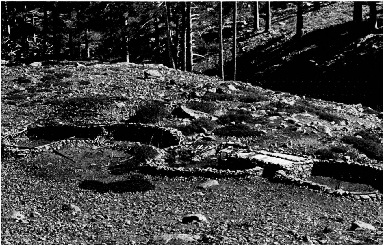
Abb. 1 Bergerie Valla Lungua im Überblick.