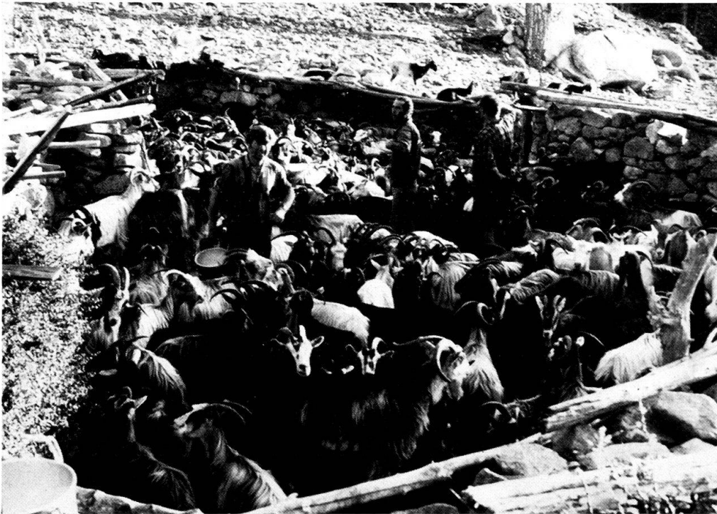
Abb. 2 Melkferch auf Valla Lungua mit Hirten und Ziegen.