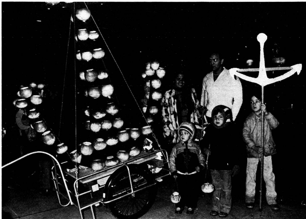
Abb. 2: Das Quartierwappen (Anker) als gestaltetes «Sujet» (Quartier Aussersihl, 1979).