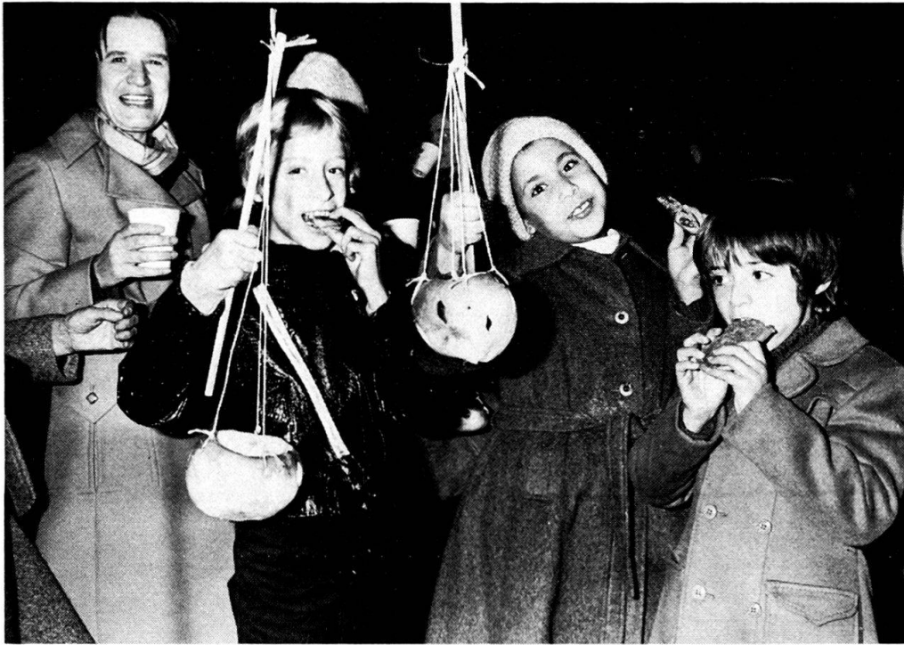
Abb. 1: «Einzelräben» nach dem Umzug (Quartier Aussersihl, 1979)