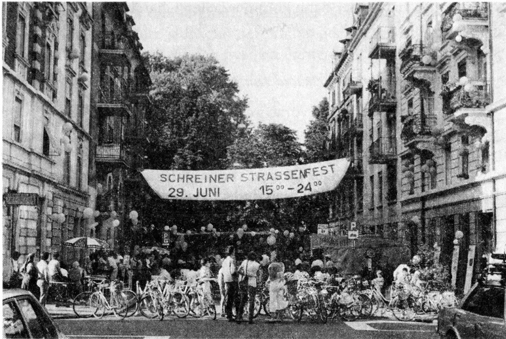
Festkultur im Quartier: Schreinerstrassen-Fest im Quartier Aussersihl.