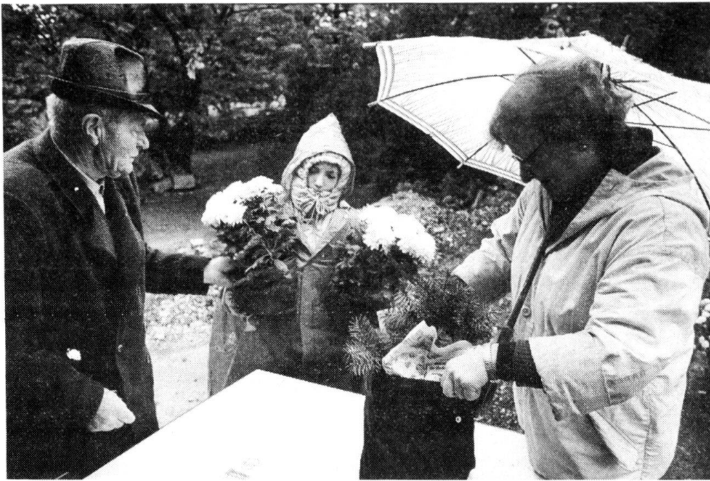
Friedhofszene 1985: Friedhof Enzenbühl, Allerseelen.