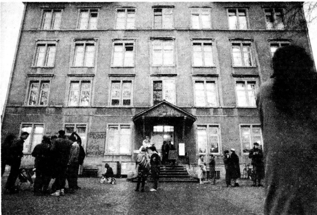
Quartierzentrum «Kanzlei»/Aussersihl. Im ehemaligen Schulhaus befinden sich die Bibliothek und der Ausstellungsraum des Historischen Vereins Aussersihl.

unterbringen wollte, ist auf Druck der aktiven Quartiergruppen ein aussergewöhnliches Quartier- und Kulturzentrum mit breitem Angebot und weitgefächerten Aktivitäten entstanden. Das Barackenkino «Xenix» bietet ein anspruchsvolles Studioprogramm von Pasolini-Zyklen, politischen Dokumentarfilmen, Avantgardisten, neuem Filmschaffen bis zur Reprise von Kurt Frühs Schweizer Filmwerk. Eine Elternselbsthilfegruppe führt einen Kindergarten; Bewegungsräume werden täglich von Karate-, Massage-, Tanz-, und Theatergruppen benutzt; das «Kanzleicafé» dient werktags der Aussersihler Szene als Treffpunkt und «Kantine» (da Aussersihl noch immer Wohn- und Arbeitsquartier ist, haben die meisten Quartieraktivisten ihren Arbeitsplatz im Quartier, sind Nachbarschaft, Arbeitsbeziehung und Freizeit sehr oft eng miteinander vernetzt); sonntags finden im Kanzleicafé regelmässig Matinéés mit Kulturprogramm von Dada bis Kammermusik statt. Das Arbeiterhilfswerk führt zusammen mit kirchlichen und gewerkschaftlichen Kreisen eine Beratungsstelle für Arbeitslose; im Keller betreibt ein Kollektiv einen