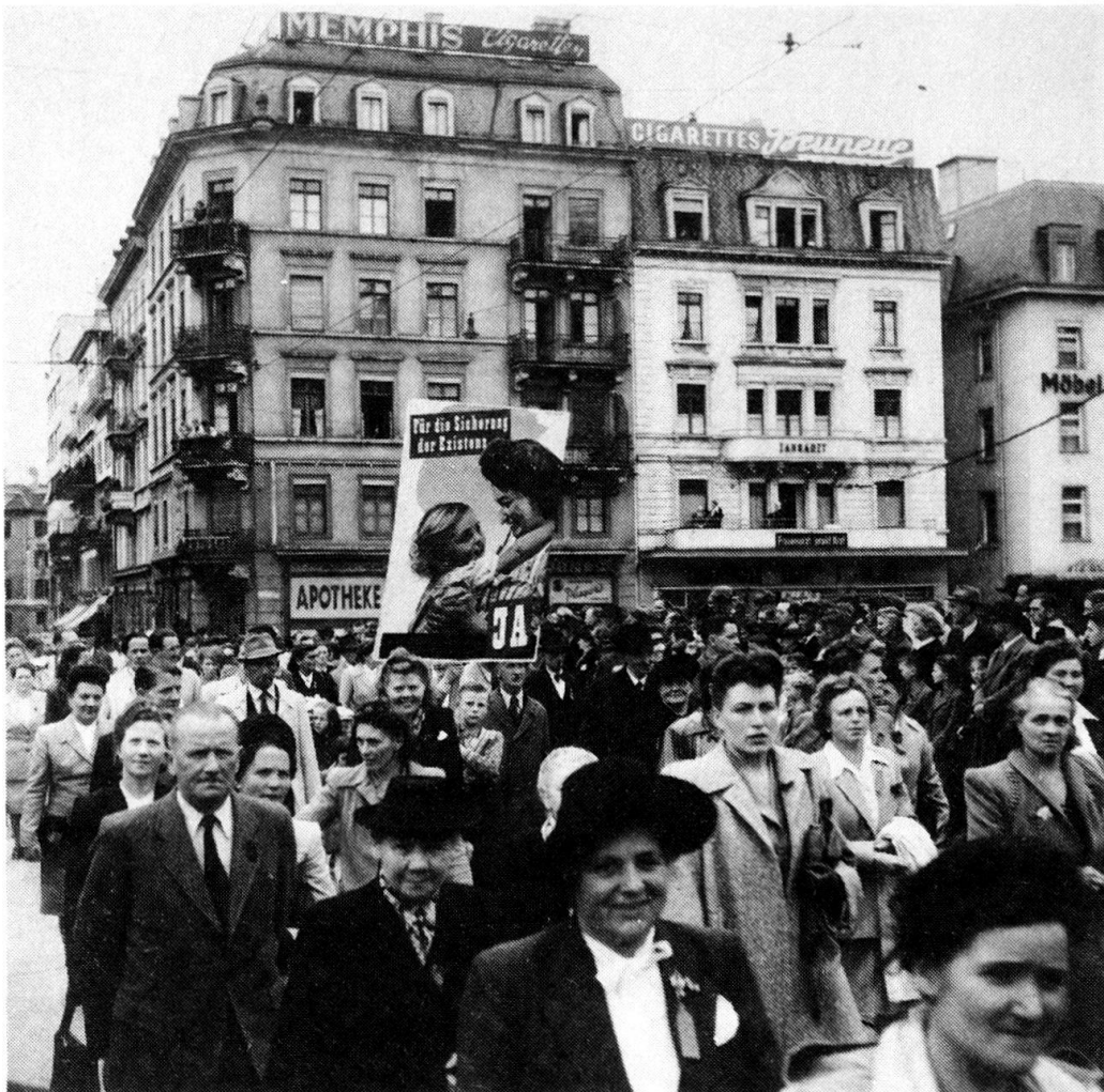
1. Mai Demonstration 1947. Häuser, Strassen, Plätze, in denen sich Geschichte abspielt: Das «Tor zum Aussersihl».