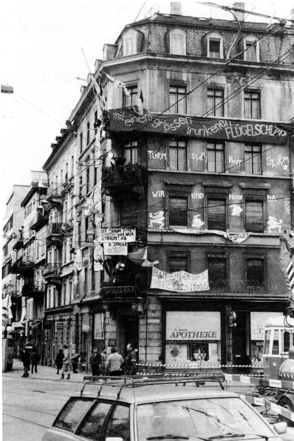
Neuer Heimatstil im Kampf gegen Häuserspekulation 1983.