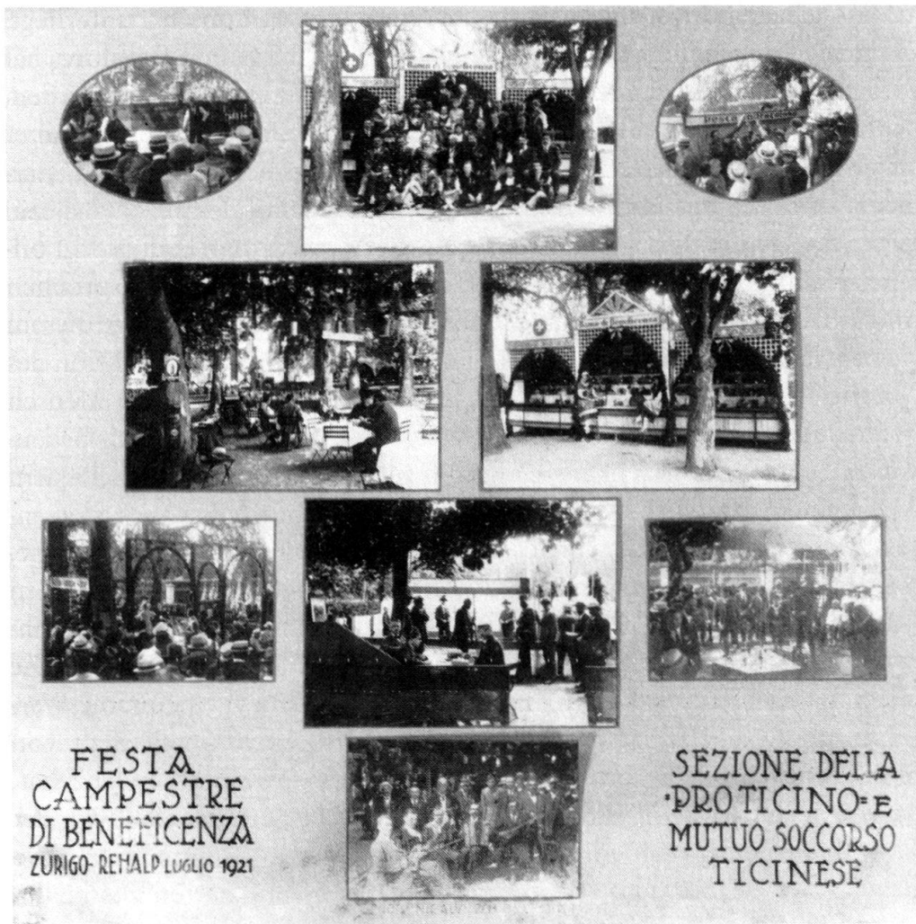
Abb. 4 Erinnerungstafel an ein Wohlfahrtsfest 1921 des ersten Tessiner Vereins in Zürich.