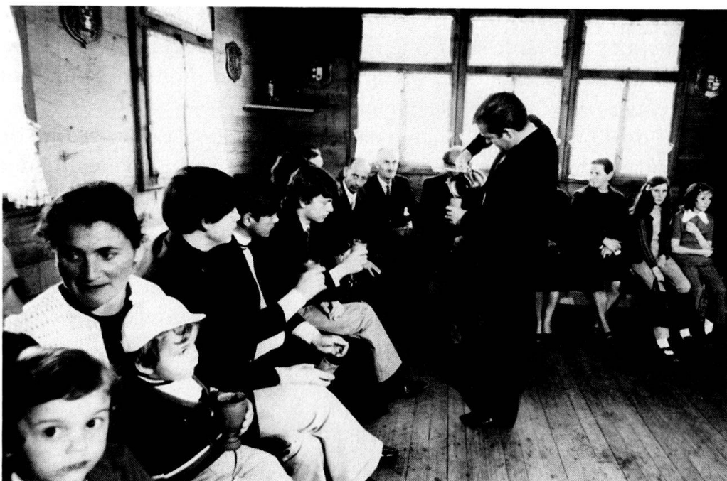
Fig. 3. Ferden, Gemeindehaus, après-midi du lundi de Pâques 1971. Le Gewaltshaber de Ferden sert un gobelet de Fendant aux donataires des villages de l'intérieur avant qu'ils reçoivent chacun une portion de Zieger et un pain.

des procédures compliquées, onéreuses et techniquement dépassées depuis quatre siècles? Ce conservatisme, explique Niederer, «est en rapport avec la fonction religieuse de la Spend. Il s'agit d'une part d'une tradition consciente issue d'une obligation religieuse affirmée, de l'autre du souhait de posséder et maintenir quelque chose de particulier, qui n'existe plus nulle part ailleurs dans notre pays.» 12