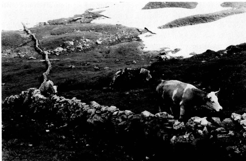
Fig. 1. Faldumalp, 22 juillet 1970. Le bétail a passé le «mur de la Spend».