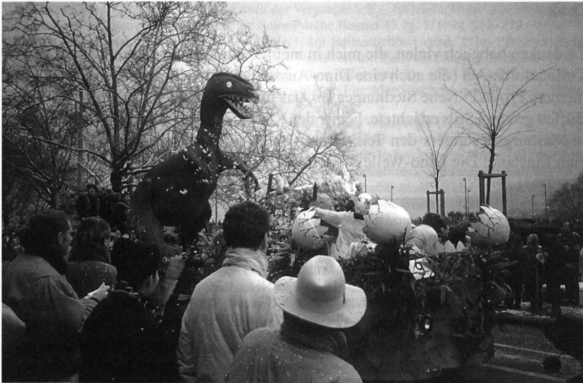
Konfettispeiendes Dino-Monster als Attraktion am Zürcher Fasnachtsumzug 1994.