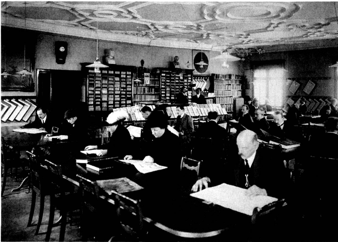
Der öffentliche Lesesaal der Pestalozzigesellschaft im Zunfthaus zum Rüden am Rathausquai (heute: Limmatquai), der von 1898 bis 1932 geführt wurde.

Der zweite Jahresbericht meldet die Eröffnung des 8. Lesesaals im Quartier Wipkingen (Hönggerstrasse 6), «das in grosser Mehrzahl eine Arbeiterbevölkerung aufweist». 31 Gleichzeitig wurde das Angebot an Zeitungen um zusätzliche 24 Zeitschriften ergänzt, die dann in den acht Lesesälen zirkulierten. Der 7. Jahresbericht 1902/1903 liefert interessante Angaben sowohl über den Ausbau des Zeitungs- und Zeitschriftenbestandes als auch über die Benutzer der Lesesäle: «Nicht eine der von 230 aufliegenden Zeitungen und Zeitschriften bleibt ganz ungelesen. [...] Sehr begehrt sind sämtliche Tageszeitungen, im Rüden [früher: Schifflande, Anm. RFE] vor allem auch das städtische Tagblatt [städt. Amtsblatt und Gratisanzeiger, erstmals erschienen 1730 als «Donnerstags-Nachrichten von Zürich»]. Denn hier findet sich mancher ein, den nicht politisches oder schöngeistiges Lesebedürfnis hertreibt, sondern die Suche nach Arbeit und Brot. Aus dem gleichen Grunde verbraucht der Rüden das meiste Schreibpapier.» 32