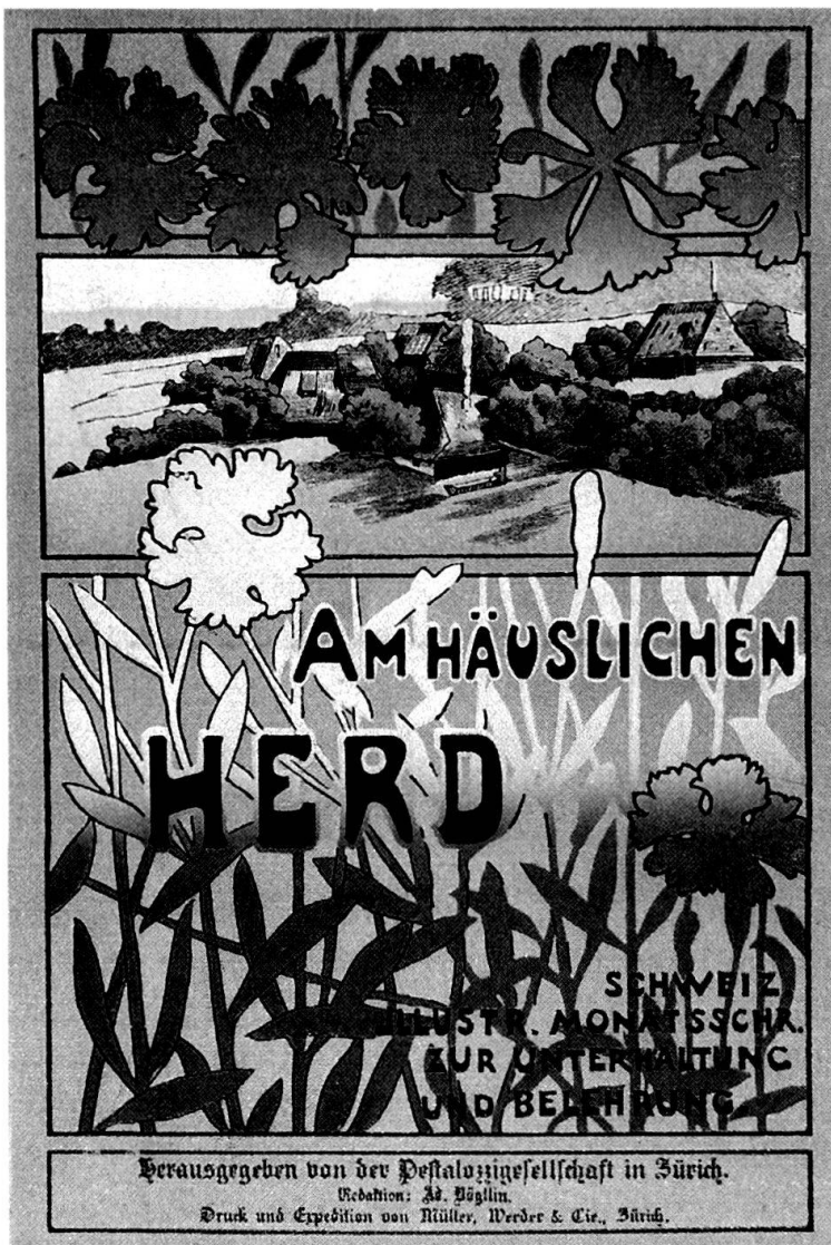
Das Umschlagbild der von der Pestalozzigesellschaft von 1897 bis 1925 herausgegebenen Zeitschrift «Am häuslichen Herd».

angemessene Entschädigung abzutreten. 56 Die Zeitschrift wurde unter dem gleichen Namen noch bis 1960 weitergeführt. Der Jahresbericht 1897/1898 der Pestalozzigesellschaft gibt Auskunft über Inhalt und Form: «Die Zeitschrift will eine vaterländische sein. Darum sind es unsere eigenen besten Schriftsteller, Dichter, Künstler, die sie dem Leser vor Augen führt, sei es in den Erzeugnissen volkstümlicher Novellistik, in Gedichten, in ausgeführten Lebensbildern. [...] Daneben suchen Aufsätze aus berufener Feder dem Leser die geistigen Strömungen auf dem Gebiet der Kunst und Literatur zum Verständnis zu bringen und den Sinn für ein ächtes häusliches Leben wie auch für das Leben in der Natur zu pflegen. Dem gedruckten Wort gesellt sich als treuer Begleiter das Bild. Durch gute Illustrationen soll die Zeitschrift die Freude am Schönen immer mehr ins Volk hinaustragen. Gute Bilder sind unbestritten ein vorzügliches Mittel zur ästhetischen Erziehung des Volkes.» 57