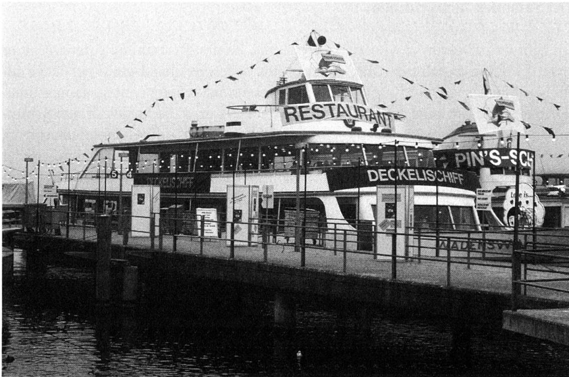
Abb. 3: Das Deckelischiff als Mekka der Sammlerinnen und Sammler (Zürich, November 1993).

len. Bereits fand auch die Weltpremiere des Kaffeerahmdeckeliliedes statt: «Mir deckeled, mir deckeled, das macht öis grosse Spass». Es war auf einer CD der Geschwister Biberstein erhältlich, die Bestellkarte im Deckeli-Heft.