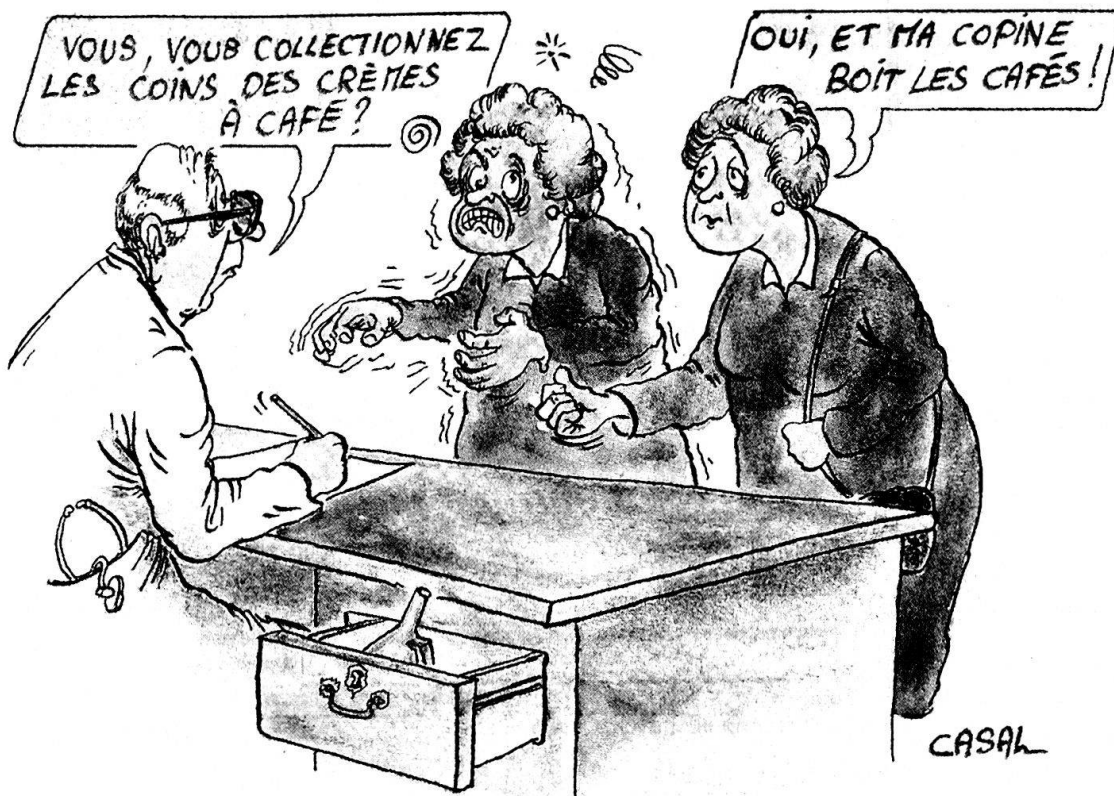
Abb. 8: Die eine sammelt die Deckeli, die andere trinkt den Kaffee. Der Cartoon aus dem Nouvelliste vom 19.12.1991 scheint einmal mehr den Beweis zu erbringen, dass in der Schweiz Sprach- und Kulturgrenzen nicht übereinstimmen.

1980er Jahren zum Volkssport. «Was jedermann sammeln kann», titelte die Frauenzeitschrift Annabelle 1980 und zählte all die «sammelbaren Kleinigkeiten» auf, die «erst entdeckt wurden und noch erschwinglich sind»: Eierbecher, Knöpfe, Email schilder, Schreibfedern... 21 Heute ist eine ganze Industrie daran, ständig neue sammelbare Dinge wie Fingerhüte, Krawatten, Porzellanpuppen, Magnete, Taschenmesser oder Zigarettenpackungen anzubieten.