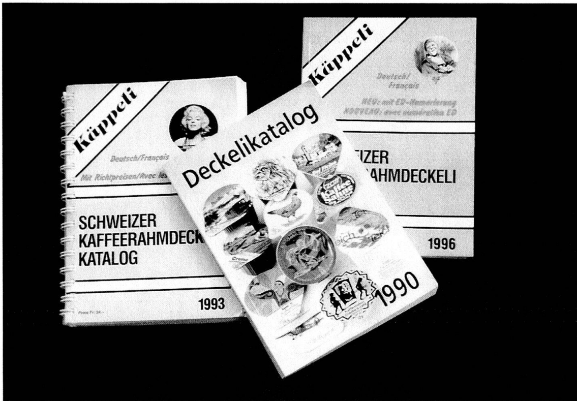
Abb. 6: Der Deckelikatalog als unerlässliches Hilfsmittel für das Sammeln und Tauschen der Kaffeerahmdeckeli.

chiges «Kade-Magazin», wie die anderen beiden im A4-Format, auf Hochglanzpapier gedruckt und in einem Umfang von 30 bis 40 Seiten.