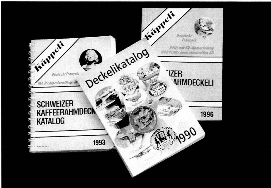
Abb. 6: Der Deckelikatalog als unerlässliches Hilfsmittel für das Sammeln und Tauschen der Kaffeerahmdeckeli.

chiges «Kade-Magazin», wie die anderen beiden im A4-Format, auf Hochglanzpapier gedruckt und in einem Umfang von 30 bis 40 Seiten.