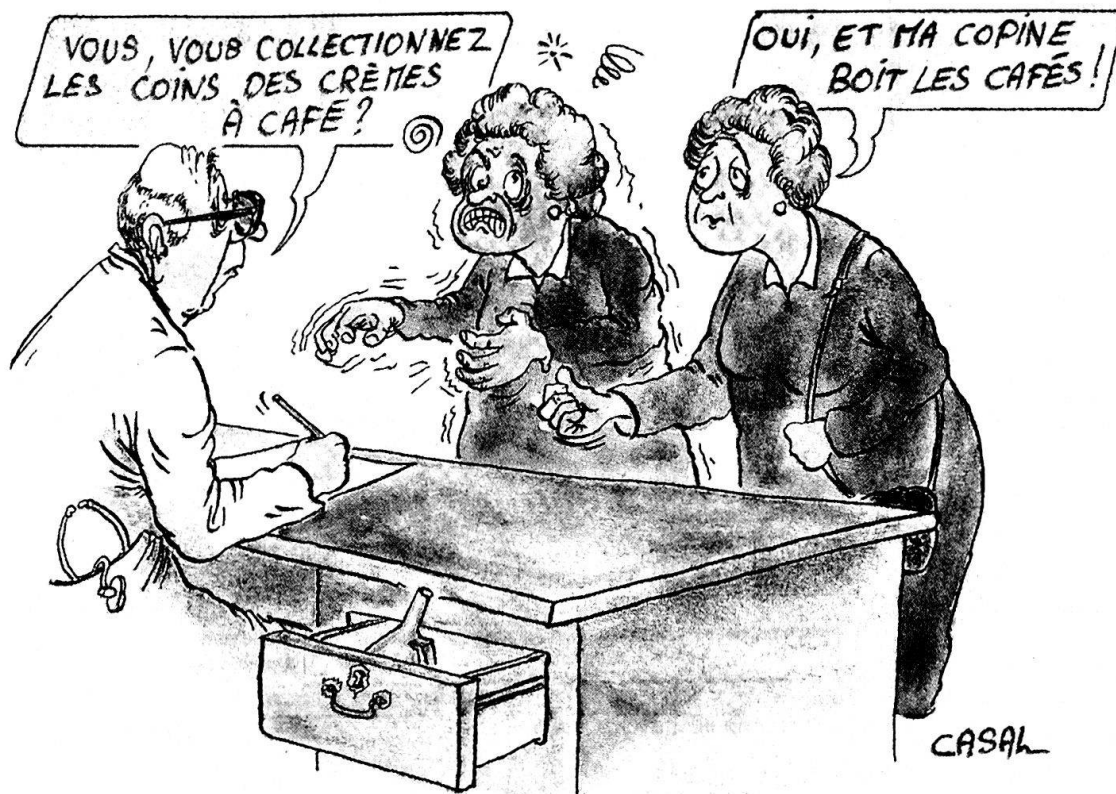
Abb. 8: Die eine sammelt die Deckeli, die andere trinkt den Kaffee. Der Cartoon aus dem Nouvelliste vom 19.12.1991 scheint einmal mehr den Beweis zu erbringen, dass in der Schweiz Sprach- und Kulturgrenzen nicht übereinstimmen.

1980er Jahren zum Volkssport. «Was jedermann sammeln kann», titelte die Frauenzeitschrift Annabelle 1980 und zählte all die «sammelbaren Kleinigkeiten» auf, die «erst entdeckt wurden und noch erschwinglich sind»: Eierbecher, Knöpfe, Email schilder, Schreibfedern... 21 Heute ist eine ganze Industrie daran, ständig neue sammelbare Dinge wie Fingerhüte, Krawatten, Porzellanpuppen, Magnete, Taschenmesser oder Zigarettenpackungen anzubieten.