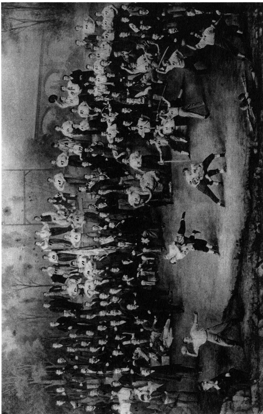
Der Bürgerturnverein Basel im Jahr 1869 (StABS PA 526 E, 8). Vorwiegend Kleinbürger organisierten sich im BTV zu gemeinsamer Freizeitgestaltung. Die Bürgerturner turnten nicht nur, sie spielten auch Theater.