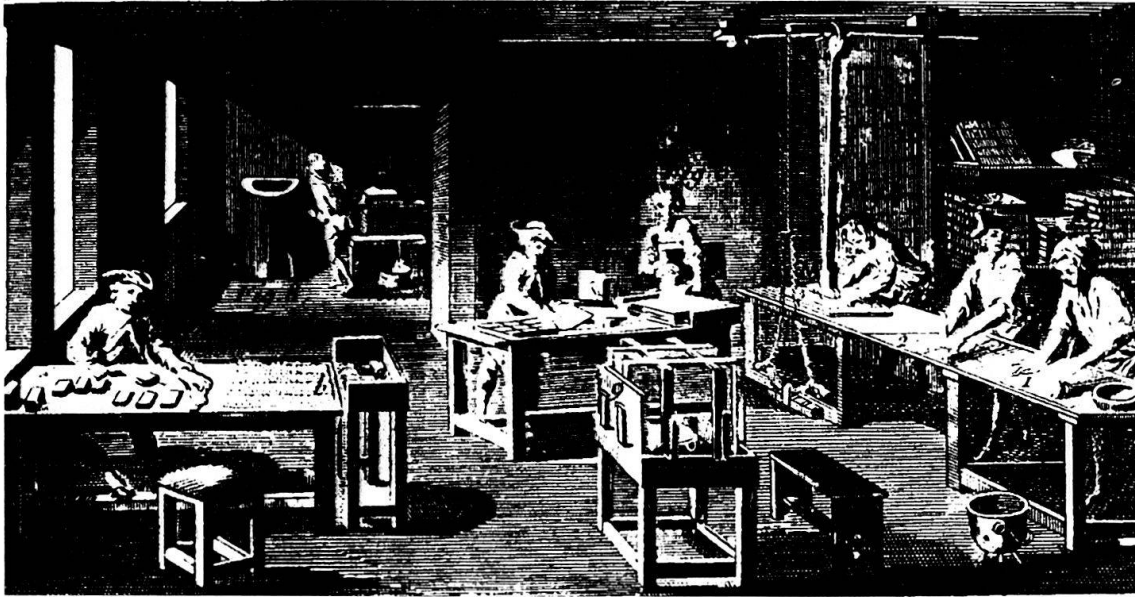
Abb. 3: Kartenmacherei

Sechs Livres kostete die Beglaubigung des Lehrabschlusses durch Jean-Baptiste Bourdelain, maître-garde der Communauté des cartiers de Lyon mit Eintrag in deren Mitglieder-Register. 15 Diese Vereinigung war 1614 von 13 Lyoner Kartenmachern gegründet worden. 16 Der Lehrmeister bescheinigte dem freigesprochenen Lehrling in origineller Orthographie, unten am Vertrag, dass er ihm treu gedient habe und arbeiten könne, wo es ihm gut scheine. Dies geschah am 4. Januar 1745.