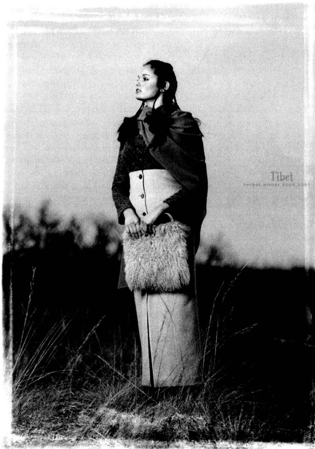
Modethema Himalaya: Das Modell «Tibet» aus der Kollektion «Berge + Mythen» des österreichischen Herstellers von «Mode, die den Bogen zwischen Zeitgeist und Ursprung spannt» Mothwurf (Herbst/Winter 2000/01)