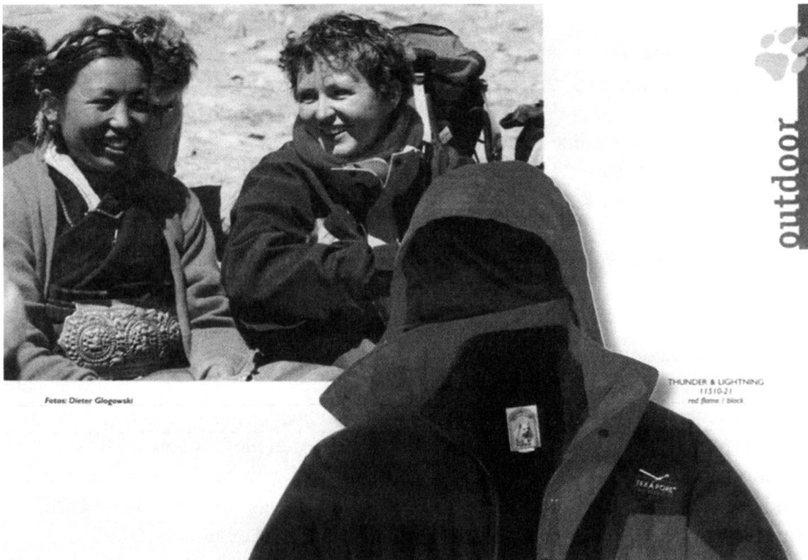
Trekking-geschulte Natur-Mystik samt Ethnoerlebnis: Reiseberichte und Fotostrecken neben den Produkten aus high-tech-Fasern (Katalog Jack Wolfskin, 1998, Ausschnitt)

Goisern selbst scheint neben der alpinistischen Tradition (Harrer, Tichy, Messner) so etwas wie eine neue Schnittstelle der alpenländischen Tibetbegeisterung zu verkörpern. In ihm verbinden sich die älteren Bergsteigerdiskurse mit den neueren aus der «Free Tibet»-Bewegung, aus westlichem Buddhismus und einer Trekking-geschulten Ästhetik: «Für mich war der Buddhismus als Geisteshaltung immer schon interessant. Ich meditiere schon seit einigen Jahren, bin über die Faszination des Bergsteigens auf Tibet gestossen. Aber was mich immer erstaunt hat, war diese Fröhlichkeit. Ich lache lieber gut, als dass ich böse drauf bin. Das habe ich mit den Tibetern gemeinsam.» 26