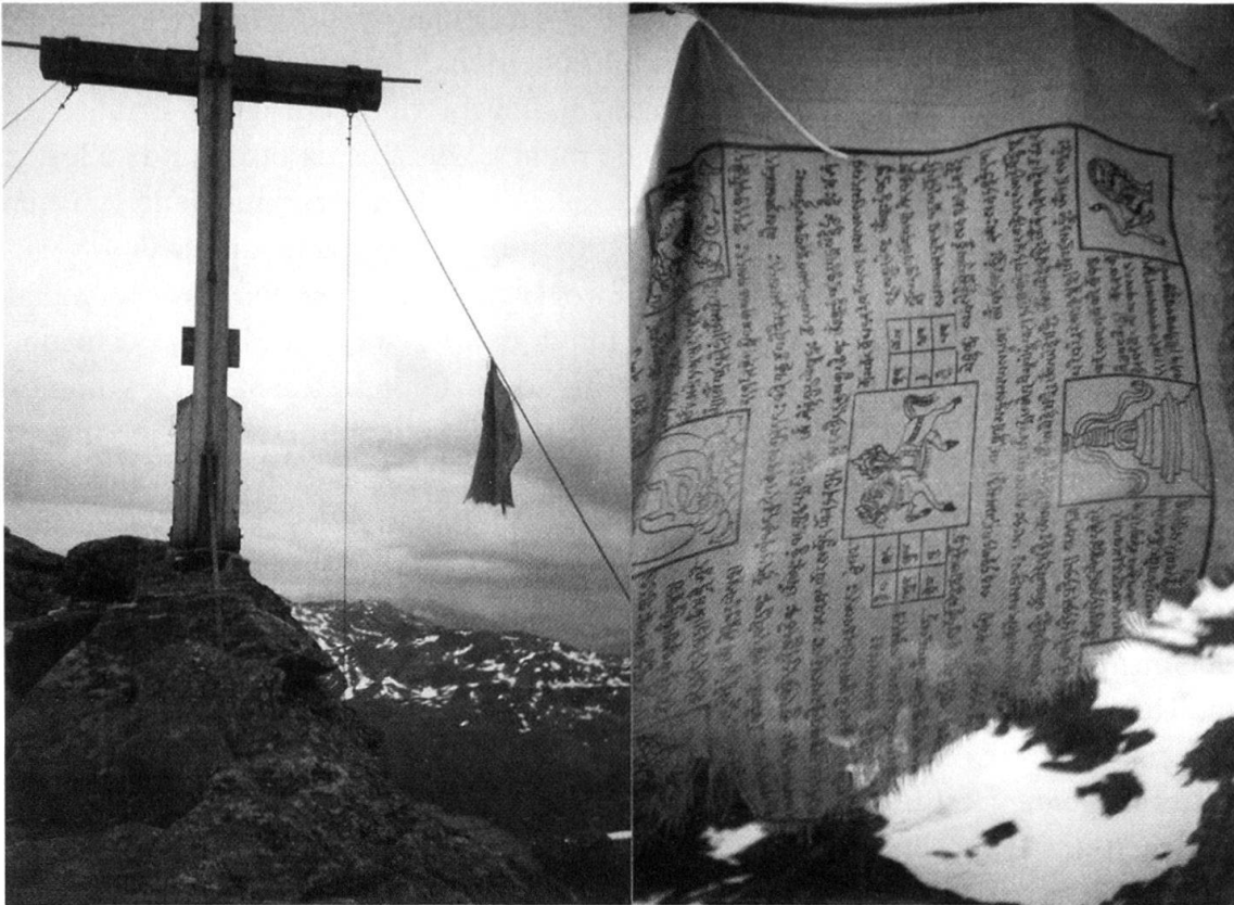
Konterkarierung des christlichen Alleinanspruchs auf die heilige Bergwelt? Mani (Gebetsfahne) auf dem Gipfel der Heimspitze bei Gargellen (Vorarlberger Silvretta)

sie geht auf einen Text der frühen siebziger Jahre zurück und hat in der ikonographischen Bestimmung eines Gegenstands der Alltagskultur der späten sechziger Jahre – und ihrer Kontextualisierungen – nichts von ihrer Aktualität verloren. 31 Andere wichtige Publikationen sind als Effekt und kritische Aufarbeitungen der Tibet-Konjunktur der vergangenen Jahre zu verstehen, ihre Titel «Mythos Tibet» (ein Bonner Tagungsband) oder «Virtual Tibet» (eine kenntnisreiche journalistisch Analyse der Tibet-Affinitäten Hollywoods) sind Programm. 32 Daneben sind auch die «Klassiker» populärster Tibetbegeisterung längst zum Gegenstand der Dekonstruktion geworden: Lobsang Rampas legendäre «Fälschung» der Autobiographie eines Lamas etwa, oder aber auch die wellnesskompatiblen Bewegungsübungen «Fünf Tibeter», welche jahrelang in den deutschsprachigen Bestsellerlisten ihren Platz behaupten konnten. 33 Solche Dinge werden längst im Feuilleton verhandelt, das auch dann und wann (besonders Hollywood bietet immer wieder reichen Anlass) Tibetologen kritisch zu Wort kommen lässt: das Wissen um den Mythos Tibet ist heute global verfügbar – ohne grosse Wirkung auf seine Rezeption allerdings, so der Eindruck. 34