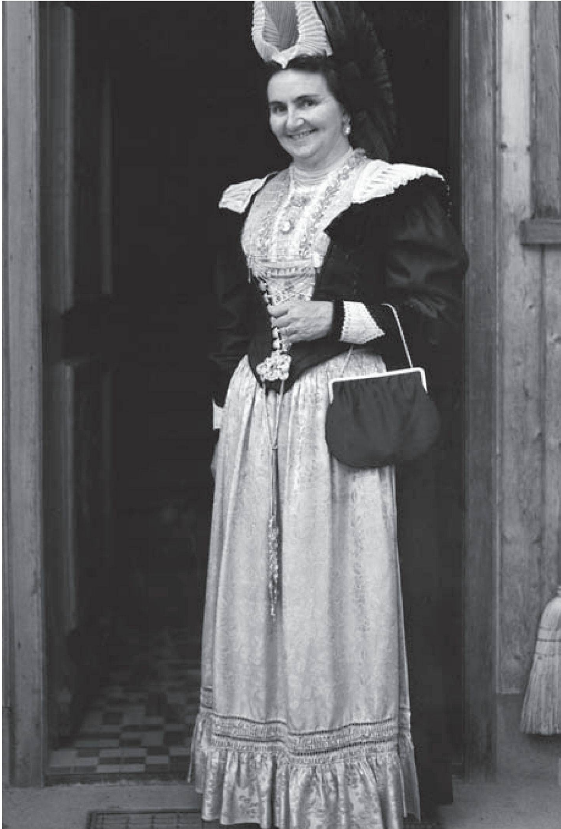
Bild 1: Frau in der Festtagstracht um 1972

«Wenn man sie anhat, ist es ein Fest und dies schon zu Hause.» (Zitat einer Trachtenträgerin aus Appenzell Innerrhoden)