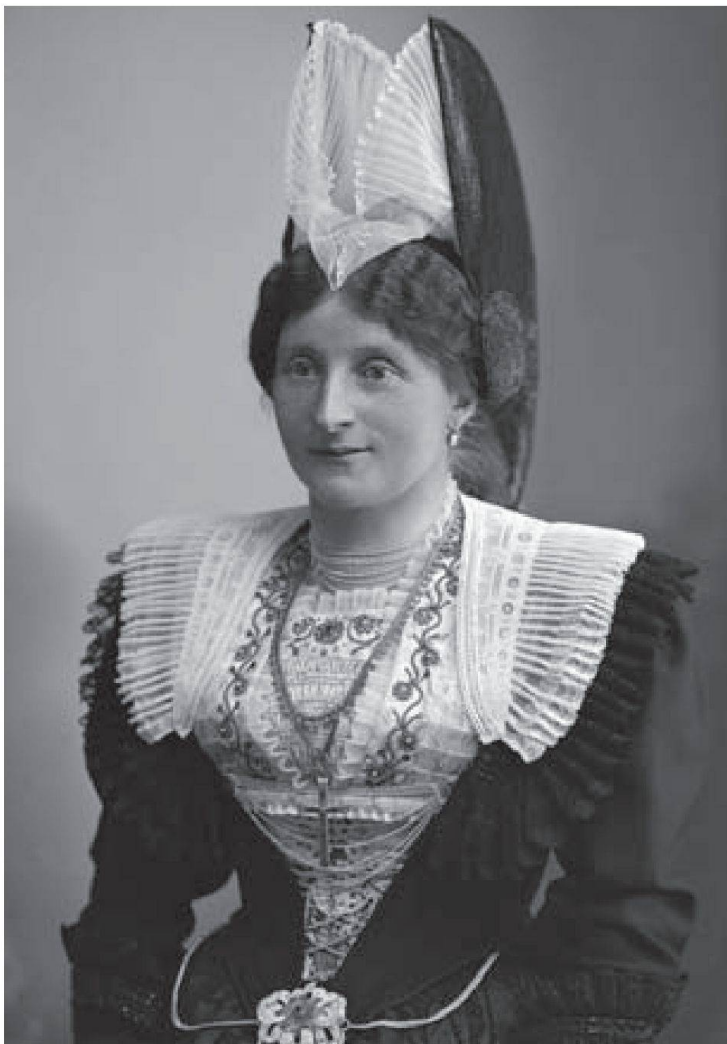
Bild 5: Schlottenfrau um 1900, Glasplatte aus der Sammlung Müller/Bachmann, Museum Appenzell

Die meisten Trachten in und ausserhalb der Schweiz präsentieren einen reichlich ausgeschmückten Oberkörper. Bei der Festtagstracht in Appenzell Innerrhoden wird diese Betonung durch die Schlotte noch zusätzlich verstärkt. Die Frauen sind in eine eng anliegende Jacke eingekleidet, die vorne weit ausgeschnitten ist und den Blick auf das reich geschmückte Brüechli und den Schmuck frei gibt. Zudem kontrastiert die dunkle Farbe der Jacke vorteilhaft mit dem farbigen, hellen Brüechli. Julie Heierli bemerkte dazu: «Die Schlotte selbst hatte ihre Vorderteile so weit geöffnet, dass das reich ausgestattete Brüechli sowie die mit Gold bestickten Vorstecker zur Schau getragen werden können. Ein witziger Spassvogel soll sich erlaubt haben, diese Schaustellung der Frauen als «ihr Altörli» zu bezeichnen.» 6 Bei der Bezeichnung «Altörli» (kleiner Altar) handelt es sich um eine ironisch-sinnliche Anspielung für diesen dekorativen Blickfang. Von dieser sinnlichen Zuweisung ist heute wenig spürbar. Einigen Frauen ist diese Hervorhebung des Oberkörpers noch nie aufgefallen oder in den Sinn gekommen, und sie denken, dass sich die Bewunderung ausschliesslich auf Kragen, Goldstickerei und Schmuck beschränkt.