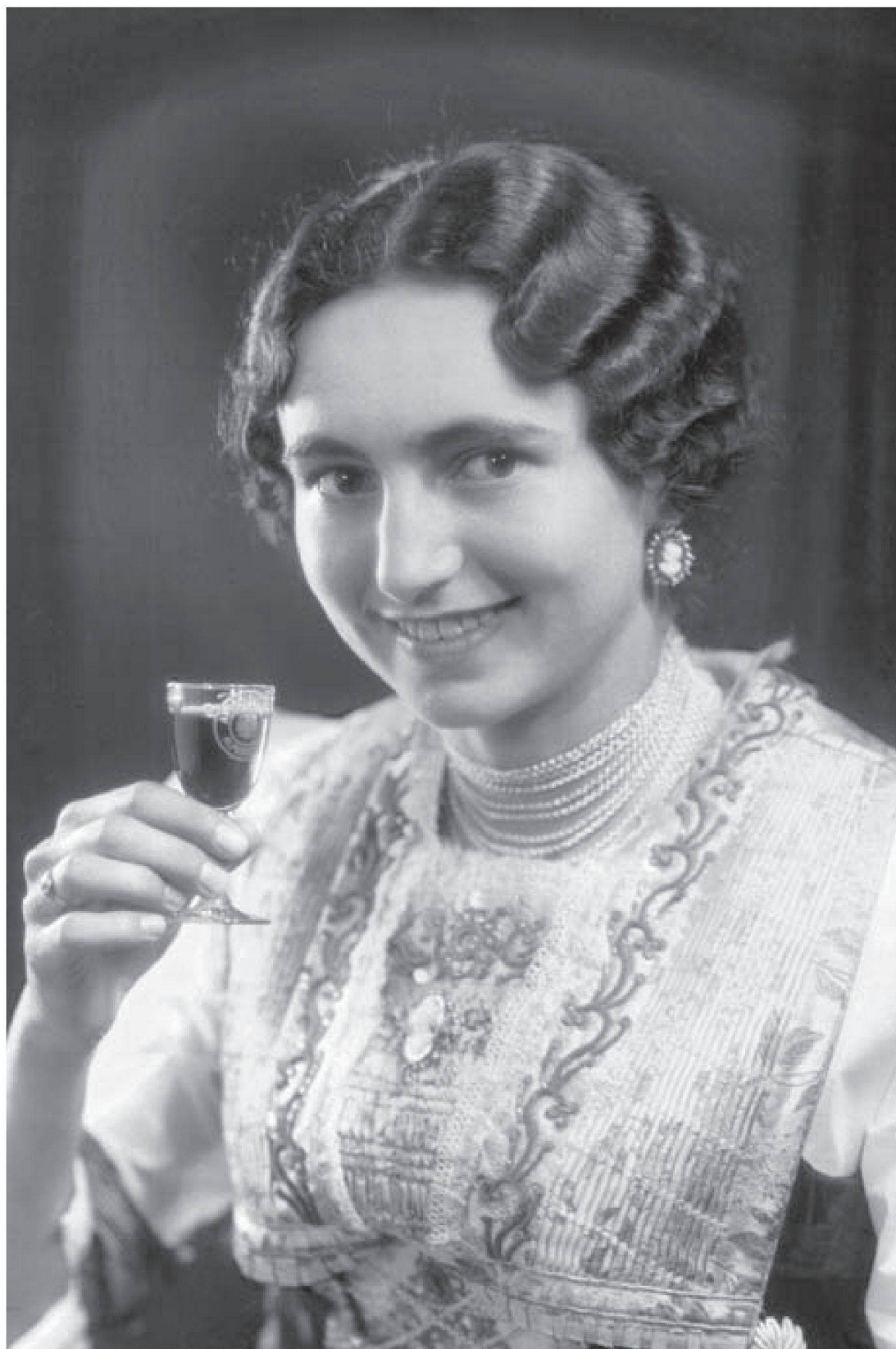
Bild 8: Frau in Barärmeltracht um 1940, Foto Werner Bachmann, Museum Appenzell

Dieses Bild diente als Werbevorlage für Appenzeller Alpenbitter.