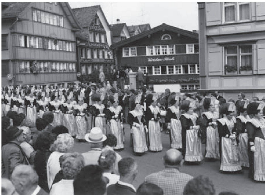
Bild 7: Schlottenfrauen an der Fronleichnamsprozession in Appenzell um 1970