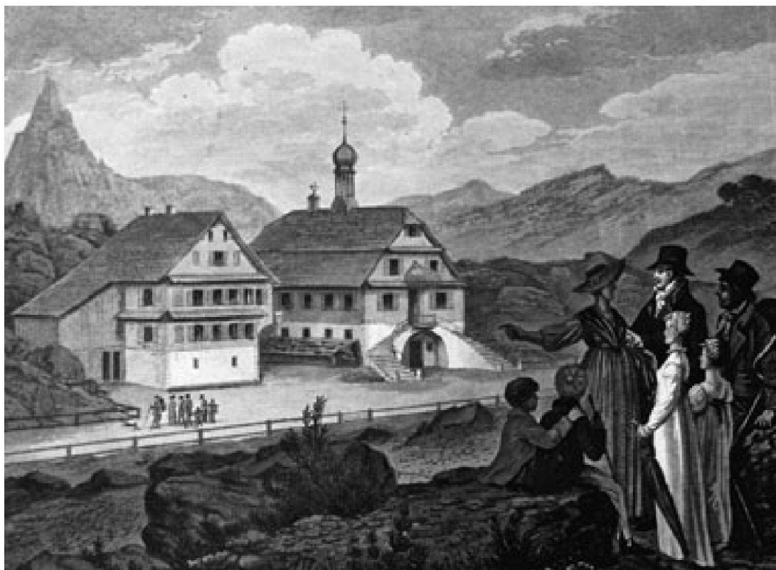
Ein Pfrundhaus, das auch als Kapelle und Schule diente, war das erste Gebäude von Neu-Goldau. 1812 kam das Gasthaus «Rössli» dazu. Dann stockte der Wiederaufbau für längere Zeit. (Franz Hegi, Zentralbibliothek Zürich)

Die Trauer um das verschwundene Goldau hinderte seine überlebenden Bewohner aber nicht daran, bald wieder praktische Erfordernisse zu verfolgen. Im Gegensatz zu den gefühlvollen Reisenden verstanden sie das Geläute vor allem als Zeitsignal und Ruf zum Gottesdienst. So war die Bergsturzglocke schon 1813 mit