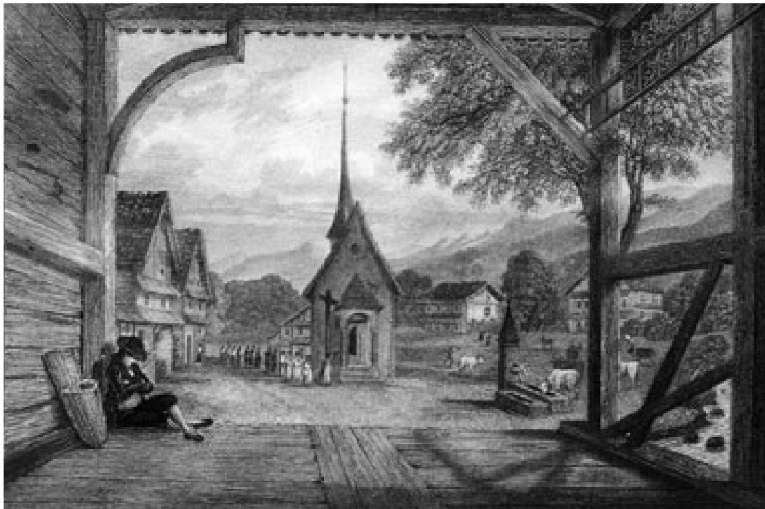
Das alte Goldau mit der gedeckten Brücke über die Rigi-Aa und der Dorfkapelle. Das zur Gemeinde Arth gehörende Dorf lag am Kreuzungspunkt zwischen dem Handelsweg von Zug nach Schwyz und dem Pilgerweg nach Rigi-Klösterli. (Johann Heinrich Meyer, Zentralbibliothek Zürich)

Die Katastrophe bricht ein in eine rurale, vorindustrielle Gesellschaft, die geprägt war von den Arbeitsgeräuschen des bäuerlichen und gewerblichen Alltags. Mühlen und Schmieden waren die prominentesten Geräuschquellen. Dazu kamen die Laute diverser Tierarten – in Goldau wurde vor allem Milchwirtschaft und Viehzucht betrieben. Da das Dorf an der Fahrstrasse von Arth nach Schwyz lag, machten sich auch Kutschen und Fuhrwagen bemerkbar, und manchmal ertönte wohl der Gesang von Pilgern, die unterwegs zum beliebten Wallfahrtsort Rigi-Klösterli waren. Zeitlich strukturiert wurde diese Kultur von den Signalen der Kirchenglocken.