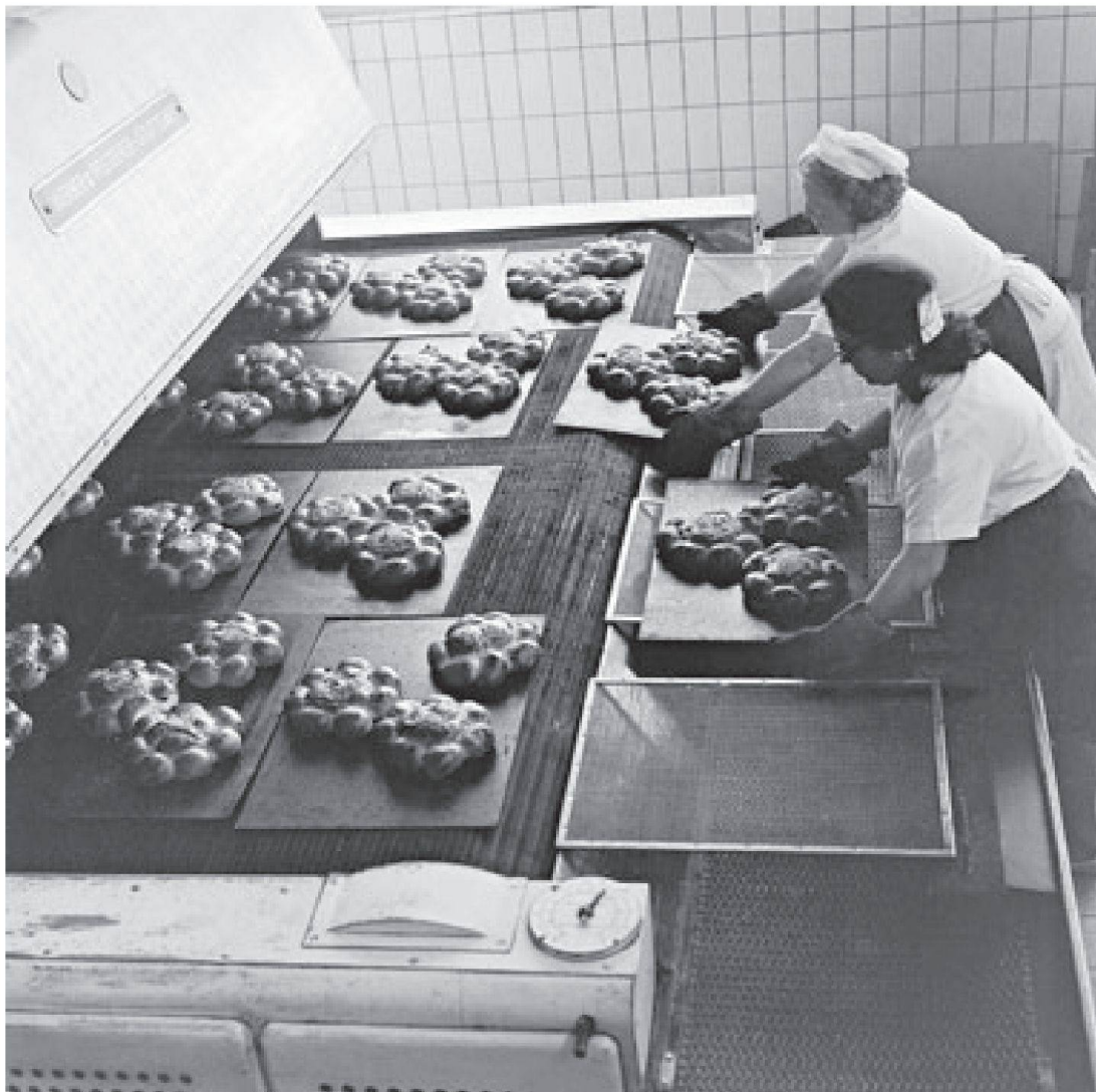
Abbildung 2: Industrielle Herstellung der Dreikönigskuchen in der Migrosbäckerei 1973 (Staatsarchiv Basel Stadt, BSL 1013 3-13-18 1,)

im Jahreslauf 1 . Der Brauch ist gegenwärtig zwar auch aus Frankreich, einigen Regionen Belgiens 2 und aus Spanien bekannt 3 , dabei belegen jedoch alleine die eindrucksvollen Zahlen die spezifische Relevanz dieses Phänomens für die Schweiz. Allein die Jowa AG, die Bäckerei des Grossverteilers Migros, produzierte im Jahr 2000 mehr als 500 000 Dreikönigskuchen (vgl. Abbildung 2), bei der schweizerischen Lebensmittelgenossenschaft Coop wurden rund 250 000 Kuchen produziert. Die Pistor als Zulieferbetrieb für die gewerblichen Bäckereien in der Schweiz, die unter anderem auch die Königs-Plastikfigürchen liefert, gibt die Produktionsmenge für