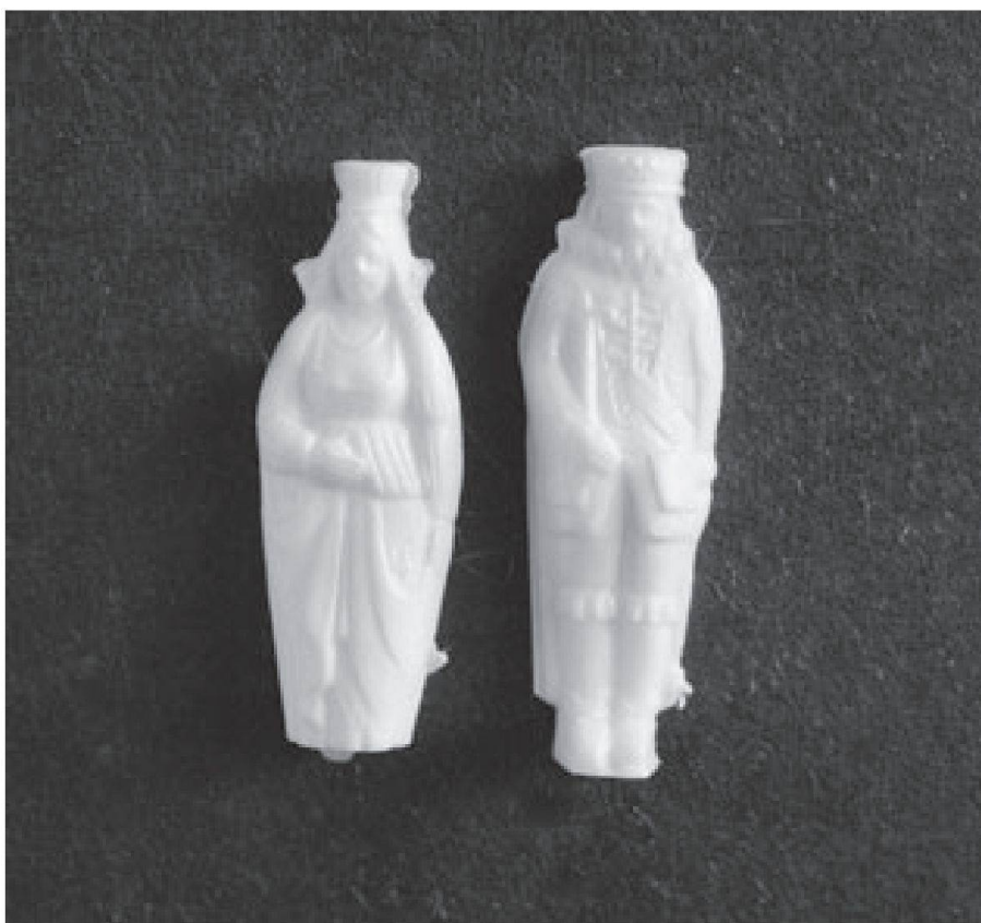
Abbildung 4: Königs- und Königinnenfigürchen 1973

Schweiz ab der «Neuerfindung» seit 1953 aus weissem Kunststoff hergestellt werden. Bereits seit Jahrzehnten waren in der Westschweiz Königinnenfigürchen weitverbreitet und haben im Zuge der Gleichstellungsdiskussion auch in der Deutschschweiz Einzug gehalten, wo sie beispielsweise oftmals paritätisch in die Kuchen verteilt werden. Die ursprünglichen Figürchen, von denen doch immerhin eine gewisse Formenvielfalt bestand (vgl. Abbildung 4), vereinheitlichen sich zusehends in der Form. Erst in jüngster Zeit machen sich hier erneut erhebliche Veränderungen bemerkbar, die wiederum meist aus kommerziellen Überlegungen stattfinden. So verkaufen die Basler Bäcker in ihren Dreikönigskuchen seit 1999 goldene