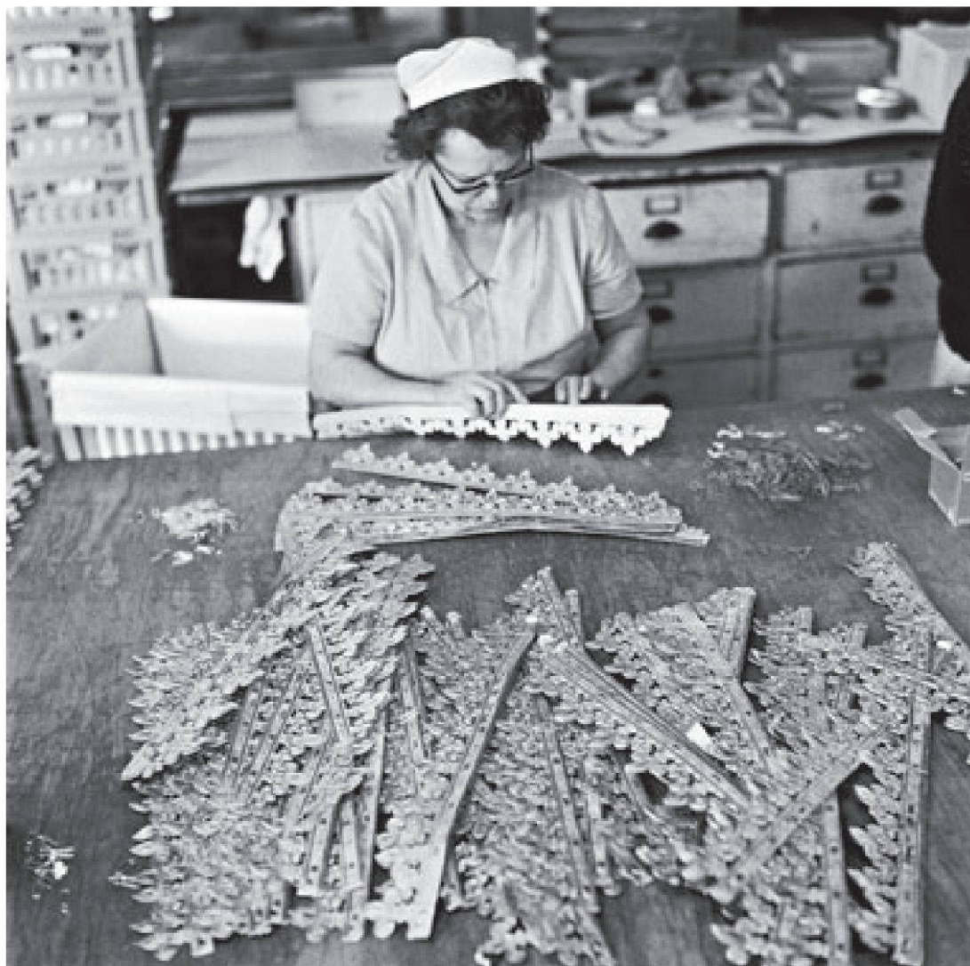
Abbildung 3: Königskronen aus Goldpapier in der Bäckerei des Allgemeinen Consum-Vereins Basel 1972

sen und hitzeresistenten Kunststoff bestehen. Auch ist der religiöse Bezug – wie er zumindest für Frankreich nachgewiesen werden kann – in der Schweiz bis zur völligen Unkenntlichkeit reduziert, so dass beispielsweise die Papierkrone zwar meist auf die französische Lilie als Symbol eines Königshauses anspielt, aber keinen Hinweis auf die «Heiligen Drei Könige» enthält (vgl. Abbildung 3). Dennoch finden sich Kirchgemeinden und Pfarreien, die Dreikönigskuchen im Anschluss an einen Epiphanie-Gottesdienst servieren. 47 Der Verzehr des Dreikönigskuchen als Ritual im familiären Rahmen des gemeinsamen Abendessens, das allenfalls in die drei Elemente «Auswählen des Kuchenstückes», «Finden des Königs», «Krönung des Finders» unterteilt werden kann 48 , genügt sich offenbar selbst und kommt ohne grosses weiteres Zeremoniell aus. Diese Knappheit an zusätzlichen Brauchelementen und die denkbar einfache Brauchausübung mit einem minimalen Repertoire an ritualisierten Elementen eröffnen dem Dreikönigskuchen als Brauchgebäck ideale