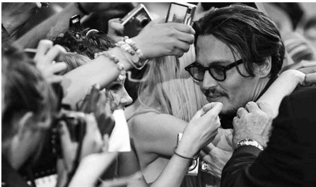
Abb. 3: Ein selbst geschossenes Foto vom Idol 24