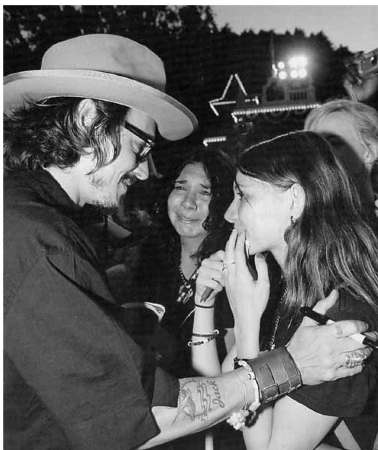
Abb. 4: So nah und doch so fern 25