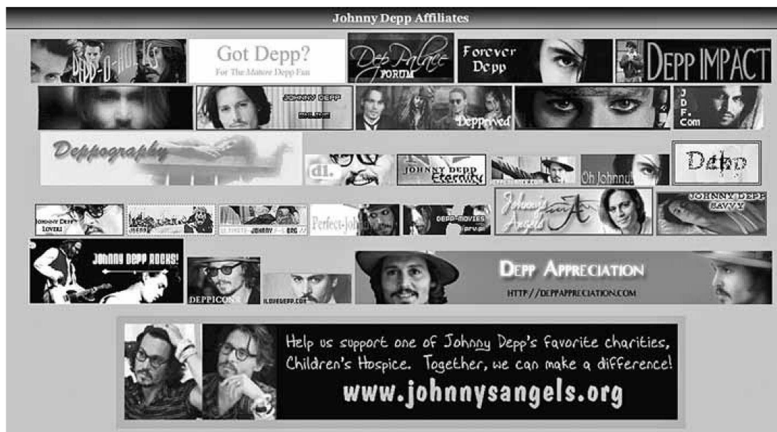
Abb. 1: Johnny-Depp-Fanseiten und -Foren 5