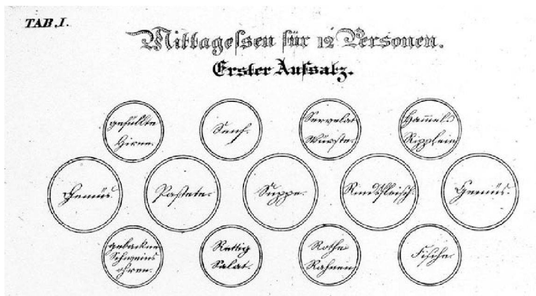
Der erste von zwei Tafelaufsätzen zu einem Mittagessen für 12 Personen. Ausschnitt aus Tafel I.