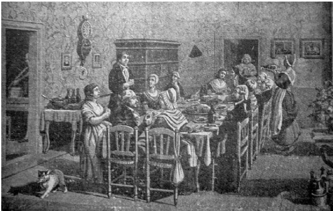
Mülhauser Hochzeitsschmaus 1796. Nach einem Aquarell von Koechlin-Ziegler, in: Elsassland 18 (1938) H. 12, S. 362.