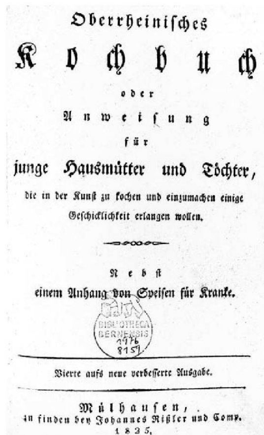
Haupttitel des Oberrheinischen Kochbuchs, 4. Auflage, Mülhausen 1825

Das einzige dem Verfasser begegnete vollständig und öffentlich zugängliche Exemplar wird in der Universitätsbibliothek Bern unter der Signatur «Hospes 204» aufbewahrt und gliedert sich wie folgt: