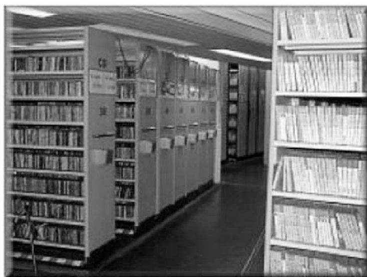
Schallarchiv des Südwestdeutschen Rundfunks

Akteure» 79 in den Blick zu nehmen: d.h., in den «Netzwerken von Artefakten, Dingen, Menschen, Zeichen, Normen, Organisationen, Texten» 80 kommt auch der Technik Handlungspotenzial zu. Was Bruno Latour z.B. am «Berliner Schlüssel» 81 , der den Imperativ zum Schliessen auf raffinierte Weise in sich trägt, exemplifiziert hat, lässt sich ohne Not z.B. auf das Handy und die vielfach darin eingeschriebenen Handlungsaufforderungen übertragen, die geradezu kategorisch den Imperativ zur Pflege und Gestaltung sozialer Kontakte ausstrahlen bzw. in die Welt klingeln.