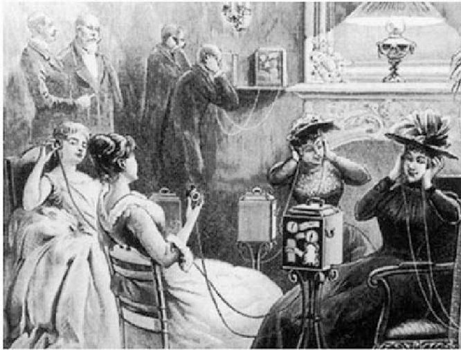
Bürgerliches Publikum am Theatrophon – einem telefonischen Vorgänger des Rundfunks.

Das Beispiel der «Erscheinung des Rundfunks» 69 macht nicht nur besonders anschaulich, was in Technik eingeschrieben ist – sei dies materiell in das Artefakt Radio, oder seien dies die Vorstellungen und Wünsche, Ängste und Hoffnungen, die sich in der Institution Rundfunk bündeln: konkret kommen im Radio/Rundfunk sowohl die Funktechnik (und damit etwa auch die dahinter liegenden Weltvernetzungs visionen und -bemühungen), forciert im Umfeld des Ersten Weltkriegs und propagiert und weitergetragen von technikaffin (geworden)en Funkern, als auch ein bürgerliches Bildungs- und Unterhaltungsideal zusammen. 70 Beide Stränge, genau so wie derjenige der Telefonie, der, wie das obige Bild zeigt, durchaus nicht nur auf dialogische Interaktion ausgerichtet war, laufen in Idee, Institution und Artefakt Radio/Rundfunk zusammen.