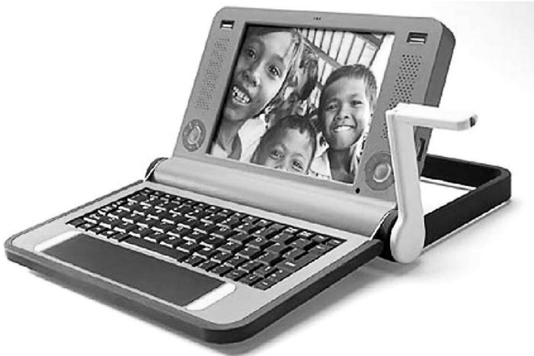
Die XO – Children Machine (vulgo Hundert-Dollar-Laptop)

fassen lassen, das wiederum von Hermann Bausinger als Spezifikum einer volkskundlichen Kulturwissenschaft herausgearbeitet wurde. Kommt dazu, dass neben diese Ungleichzeitigkeiten auch technisch mediierte bzw. induzierte Ungleichheiten treten, etwa das, was als digital divide , als digitale Kluft hinsichtlich des Zugangs zu Informations- und Kommunikationsmedien und -möglichkeiten beschrieben wird.