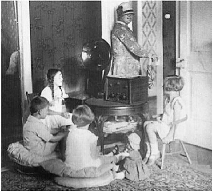
Fotografie aus dem Jahr 1928.

Das bürgerliche Dispositiv Rundfunk ist in dieser Fotografie aus dem Jahr 1928 geradezu idealtypisch in Szene gesetzt: Die Kinder sind im Halbrund um das Radioempfangsgerät mit separatem Lautsprecher gruppiert (zu Günter Anders Wertung dieser Situation siehe unten) und scheinen einem medialen Geschichtenerzähler zu lauschen. Die Situation suggeriert Häuslichkeit, ja der Rundfunk erscheint geradezu als familiär.