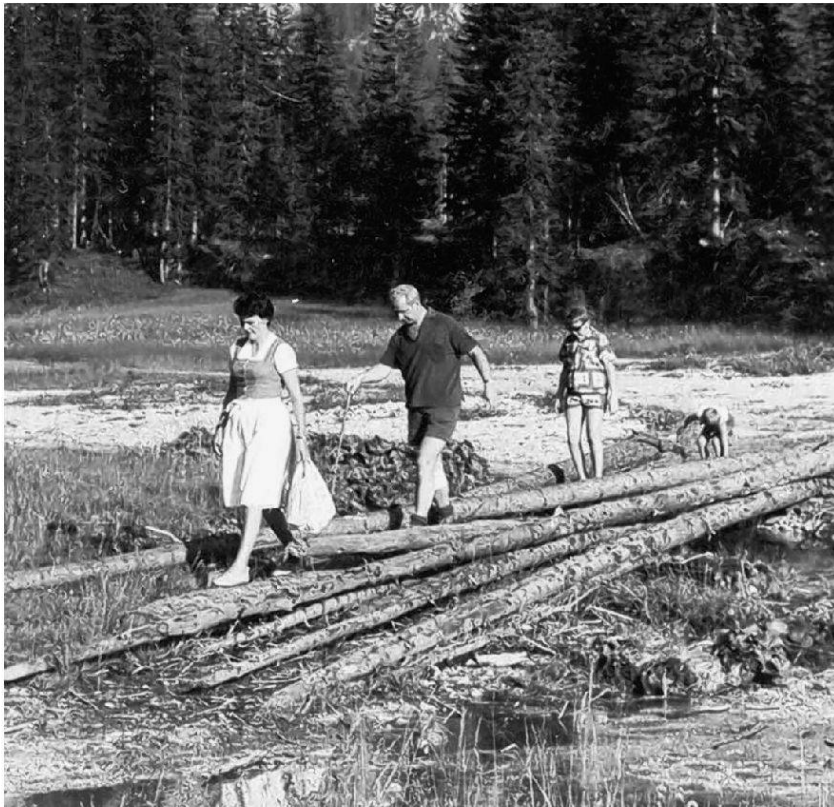
Mit den Füßen sehen – gestimmt für besondere Erfahrungen: Familienwanderung im Gebirge, Semmering um 1960

sich bei solchen Angeboten eine Art affektiver Habitus einstellt, der sowohl im räumlichen Arrangement liegt als er auch medial präfiguriert ist und durch die Begegnung mit der materiellen Umwelt stimuliert wird. Die Wanderer auf diesen Wegen lassen sich auf den teilweise in Anlehnung an eine TV-Doku gestalteten Sites berühren, indem sie sich mit ihren Vorstellungen körperlich involvieren lassen. Sarah Willner hat sie bei ihren Forschungen als Experten des Authentischen kennengelernt, kompetent in der Beherrschung zumal der Körper- und Wahrnehmungstechniken, die historische Nähe in natürlicher Umgebung evident werden lassen. Ähnliches hat Orvar Löfgren bereits vor einigen Jahren mit Blick auf touristischen Landschaftskonsum formuliert: