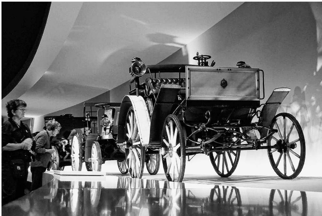
Raum, Körper, Objekte: Fahrten der Information als musealer Bewegungsmodus (Foto: B. Tschofen, Mercedes-Benz Museum, Stuttgart 2012)

Die lange Dominanz institutionengeschichtlicher und bildwissenschaftlicher Zugänge scheint dem Museum immer wieder seine räumlich-materielle Dimension zu nehmen und Museumswahrnehmung auf das Semiotische zu verkürzen. Dabei empfehlen schon die aktuellen theoretischen Orientierungen, dem Raum und damit der bewegten Perzeption mehr Aufmerksamkeit zu schenken. Ein relationaler Authentizitätsbegriff, aber auch Konzepte wie Evidenz und Präsenz,