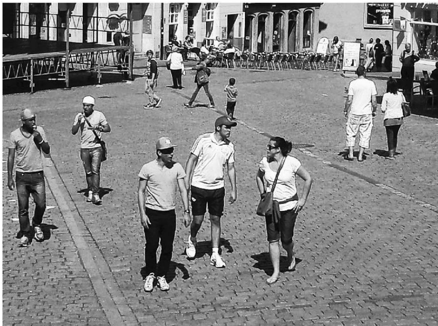
Sich ergehen, was es zu sehen gibt: der touristische Gang

Im Rahmen eines dreisemestrigen Studienprojekts «HeimatStadt Stuttgart» haben wir vor einigen Jahren eine Vielzahl offener Interviews mit Bürgerinnen und Bürgern geführt, um etwas über Erfahrungen des Städtischen und die Veräumlichung sozialer Beziehungen zu erfahren. 38 Die Empirie war von Experimenten mit innovativen Methoden begleitet 39 , auf diese Weise sollte etwas über die vorsprachliche und affektive Dimension in Erfahrung gebracht werden. Zwar sprach der Leitfaden dezidiert auf Ortsbeziehungen an, dennoch waren wir überrascht, wie sehr es unsere Interviewpartnerinnen und -partner in einem doppelten Wortsinn immer wieder hinauszog, um Formen der Beheimatung in der materiellen Umwelt explizieren zu können. Mental maps , die wir zeichnen liessen, stellten Mobilitäten und Bewegungslinien im Raum in den Vordergrund. Was wir abstrakt als relationale Raumbeziehung fassten, erwies sich in den Auslegungen der Bürgerinnen und Bürger als diskursiv gerahmte, dabei aber affektverhandelte Erfahrung von Wegen und Orten. Kommentierte Wahrnehmungsspaziergänge, die wir in Anlehnung an die methodischen Vorschläge von Jean-Paul Thibaud 40 mit einigen Interviewten unternahmen – nicht wenige davon auf deren Veranlassung, weil sie uns «zeigen» wollten, wie sich bestimmte Qualitäten ihrer Stadt, ihres Viertels anfühlen –, verwickelten auch die Interviewenden in raumperzeptuierende Praktiken, in denen sich taktile Erfassung und emotionale Strukturierung bedingten.