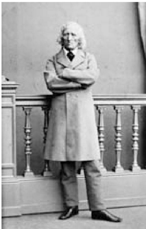
Jacob Grimm (1862), im 78. Lebensjahr.

Grimm macht Lebendigkeit zu einem normativen Marker, semiologisch gesprochen: zum qualifizierenden Zeichen des Zeichens. Und es wird deutlich: Die kontrastreiche Vielfalt von Gegensätzen ist wiederum ein Zeichen, nämlich für die Lebendigkeit einer Sprache und Kultur. Jeder einzelne Gegensatz repräsentiert gewissermassen eine Spanne des Sagbaren, Sichtbaren, Lebbaren. Alle Oppositionen zusammen genommen aber repräsentieren die gesamte Spannweite von Alternsmöglichkeiten in einer Kultur.