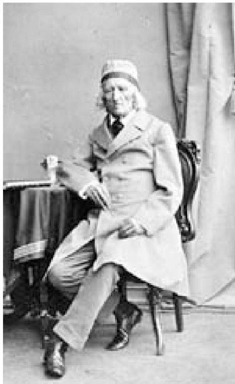
Jacob Grimm (um 1862), im ca. 76. Lebensjahr.

Demokratischer altern: Es handelt sich um die diffizile Kunst, vielfältige, widersprüchliche und letztlich unversöhnliche Aspekte des Lebens auszumitteln. Das ist eine Kunst tatsächlich auch im ästhetischen Sinne. Denn das rechte «Mass» zu treffen, die «Mitte», ist der erste Beweggrund der Kunst, der Poesie, sagt Aristoteles. 95 Jede «ächte Poesie» aber bewährt sich darin, sagt Grimm, «dass sie niemals ohne Beziehung auf das Leben seyn kann». 96 Solche Poesie verhält sich allerdings progressiv: 97 Sie steigert sich, sie wird demokratischer, je differenzierter und komplexer sich das Leben darstellt – das öffentliche und kulturelle wie dasjenige jedes einzelnen Menschen. Die Mitte zu treffen und zu halten, ist eine Kunst für das Leben, und zwar in jedem Alter – eine Lebenskunst.