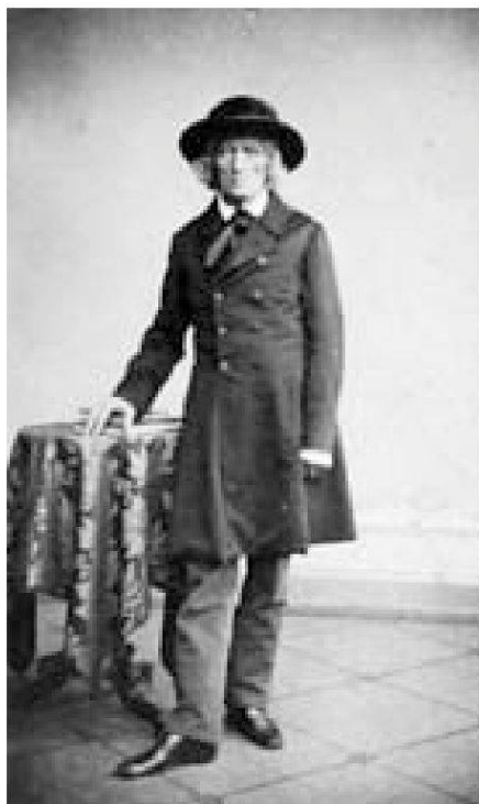
Jacob Grimm (1860), im 76. Lebensjahr.

Verhältnisse, Verschiedenheiten, Betrachtungen – anders gesagt: Kontext, Differenz 12 , Reflexion – das sind die neuen Leitbegriffe für die Darstellung des Alters. Und sie entfalten sich vor allem unter drei Perspektiven: Arbeit, Leben und Sprache. 13 Arbeit: Damit wird Alter im Kontext von Klassen, Schichten und Milieus gesehen, als soziale Frage aufgeworfen, aber auch als Frage von Potenzialen und Leistungen für die gesamte Gesellschaft. Leben: Damit richtet sich die Aufmerksamkeit auf die Vielfalt von Alternsmöglichkeiten, auf Fragen von Differenz und Individualität, auf Alterungsprozesse jedes einzelnen Menschen wie der Bevölkerung im Ganzen. Sprache: Damit treten Reflexionen über die Darstellung des Alters, über kulturelle Repräsentationen, an die Stelle von überlieferten Eindeutigkeiten oder religiösen Bestimmungen.