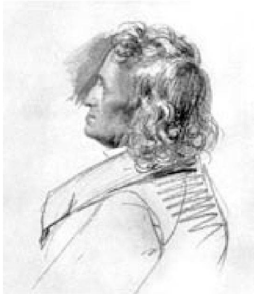
Jacob Grimm (1840), im 56. Lebensjahr. Aquarellierte Bleistiftzeichnung von Franz Krüger

Darüber hinaus aber richtet Grimm den Blick auf Befähigungen des Alters weit über die Arbeit hinaus. Was leisten alte Menschen für ihr Umfeld, für die Familie, die Nachbarschaft? Mehr als eine Last sind sie doch ein Gewinn für das Gemeinwesen, spricht Grimm ganz auf der Höhe heutiger Forschungen über die «Potenziale des Alters in Kultur und Gesellschaft». 29 Und der wohl grösste Vorzug des Alters besteht in der Möglichkeit einer vita activa . Mit diesem Gedanken streitet Grimm auch politisch gegen das Bild altersbedingter Restriktion und Passivität: «je näher wir dem grabe treten», «desto ferner weichen von uns sollten scheu und bedenken, die wir früher hatten, die erkannte wahrheit, da wo es an uns kommt,