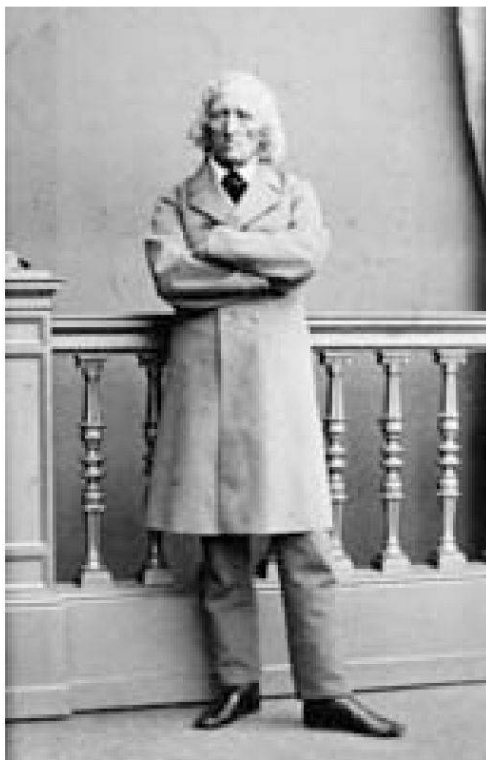
Jacob Grimm (1862), im 78. Lebensjahr.

Grimm macht Lebendigkeit zu einem normativen Marker, semiologisch gesprochen: zum qualifizierenden Zeichen des Zeichens. Und es wird deutlich: Die kontrastreiche Vielfalt von Gegensätzen ist wiederum ein Zeichen, nämlich für die Lebendigkeit einer Sprache und Kultur. Jeder einzelne Gegensatz repräsentiert gewissermassen eine Spanne des Sagbaren, Sichtbaren, Lebbareren. Alle Oppositionen zusammen genommen aber repräsentieren die gesamte Spannweite von Alternsmöglichkeiten in einer Kultur.