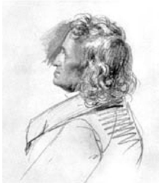
Jacob Grimm (1840), im 56. Lebensjahr. Aquarellierte Bleistiftzeichnung von Franz Krüger

Darüber hinaus aber richtet Grimm den Blick auf Befähigungen des Alters weit über die Arbeit hinaus. Was leisten alte Menschen für ihr Umfeld, für die Familie, die Nachbarschaft? Mehr als eine Last sind sie doch ein Gewinn für das Gemeinwesen, spricht Grimm ganz auf der Höhe heutiger Forschungen über die «Potenziale des Alters in Kultur und Gesellschaft». 29 Und der wohl grösste Vorzug des Alters besteht in der Möglichkeit einer vita activa . Mit diesem Gedanken streitet Grimm auch politisch gegen das Bild altersbedingter Restriktion und Passivität: «je näher wir dem grabe treten», «desto ferner weichen von uns sollten scheu und bedenken, die wir früher hatten, die erkannte wahrheit, da wo es an uns kommt,