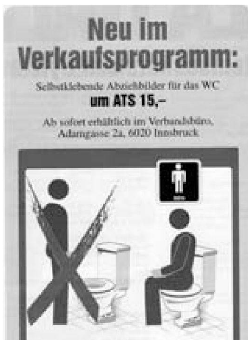
Abb. 1: Selbstklebendes Abziehbild aus dem Sortiment des Verbandes der Tiroler Privatvermieter. Der private Beherberger 2000, Nr. 1, S. 7.