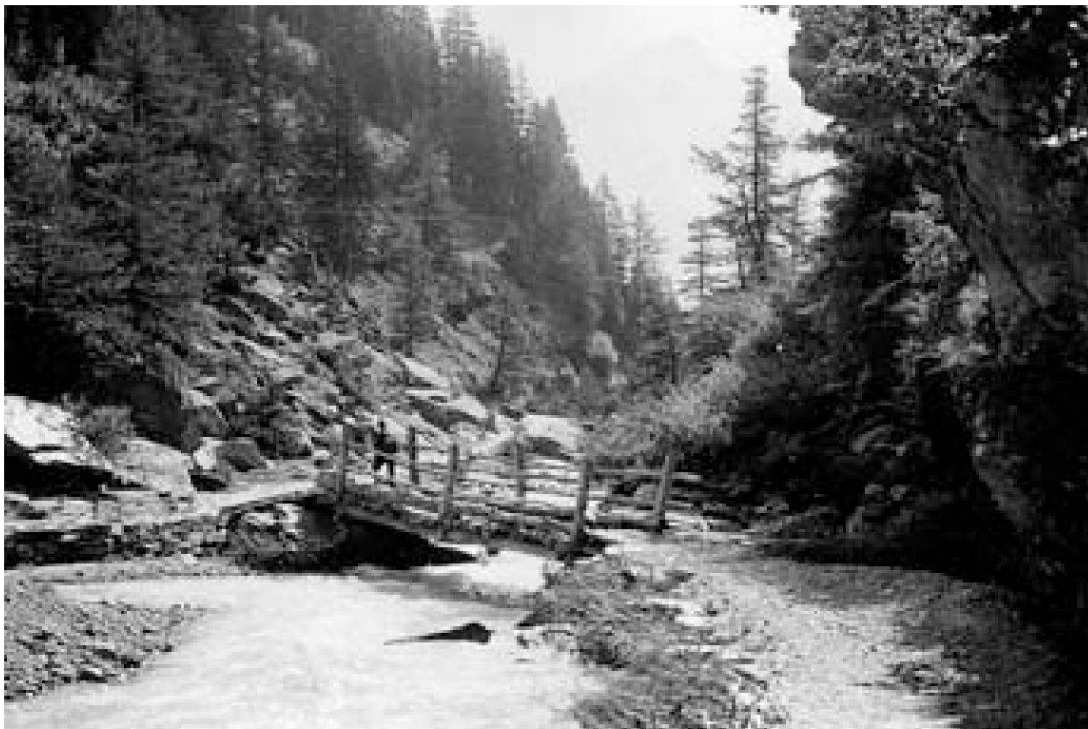
Abb. 3: Brockmann-Jerosch als Doktorand im Puschlav, ca. 1903 (Archiv Institut für Populäre Kulturen, Zürich).