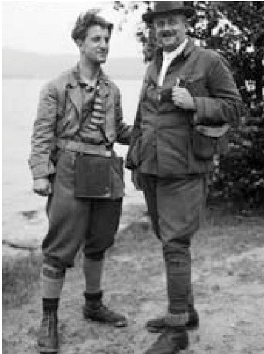
Abb. 1: Heinrich Brockmann-Jerosch (rechts) auf Exkursion in der Tschechoslowakei, 1926.