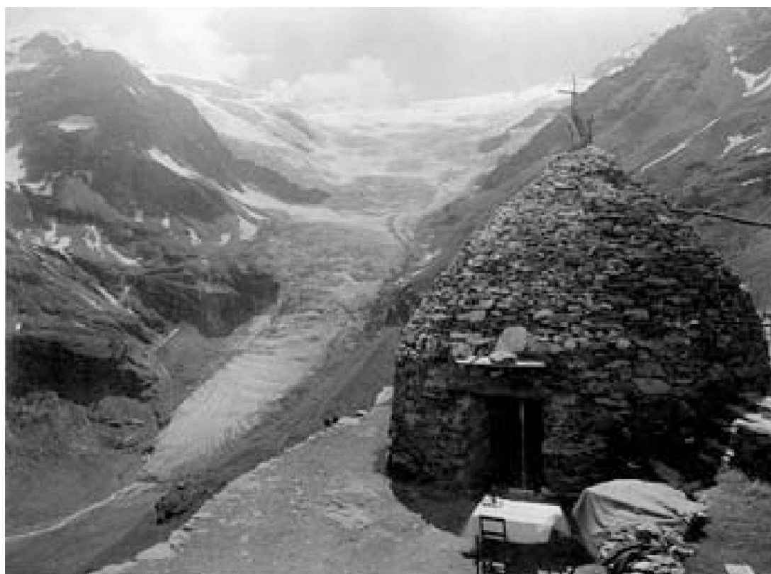
Abb. 6: Steinhütten auf Sassal Masone am Berninapass. Fotografie von Brockmann-Jerosch, ca. 1903 (Archiv Institut für Populäre Kulturen, Zürich).