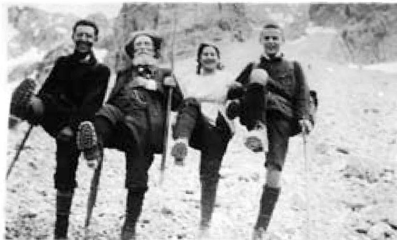
Abb. 9: Ausgelassene Stimmung in der Schröter'schen Exkursionsschule.