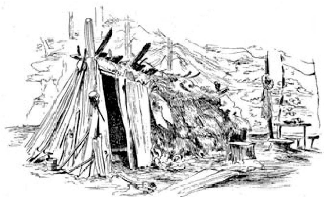
Abb. 2: Köhlerhütte als exemplarische Urform: Illustration aus «Schweizer Bauernhaus», 1933.