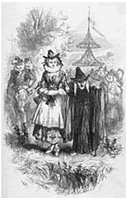
Abbildung 3: Die beiden Hexentypen – jung und attraktiv oder alt und hässlich – bei Ainsworth