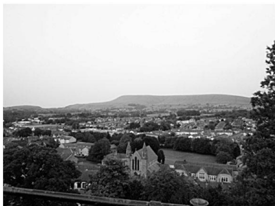
Abbildung 4: Pendle Hill von Clitheroe aus