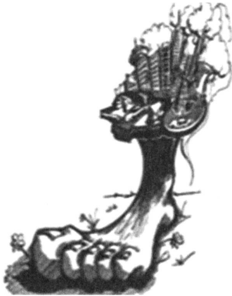
Abb. 5: Visualisierung des ökologischen Fussabdrucks, Wackernagel/Rees 1997, S. 18. © Phil Testemale

zu vollbringen – so wie jedem menschlichen Individuum. An diesem Beispiel wird deutlich, dass die Rede von einer Spezies ganz unterschiedliche Optionen bereithält und deutlich differenzierter ausfallen kann, als Chakrabarty dies befürchtet.